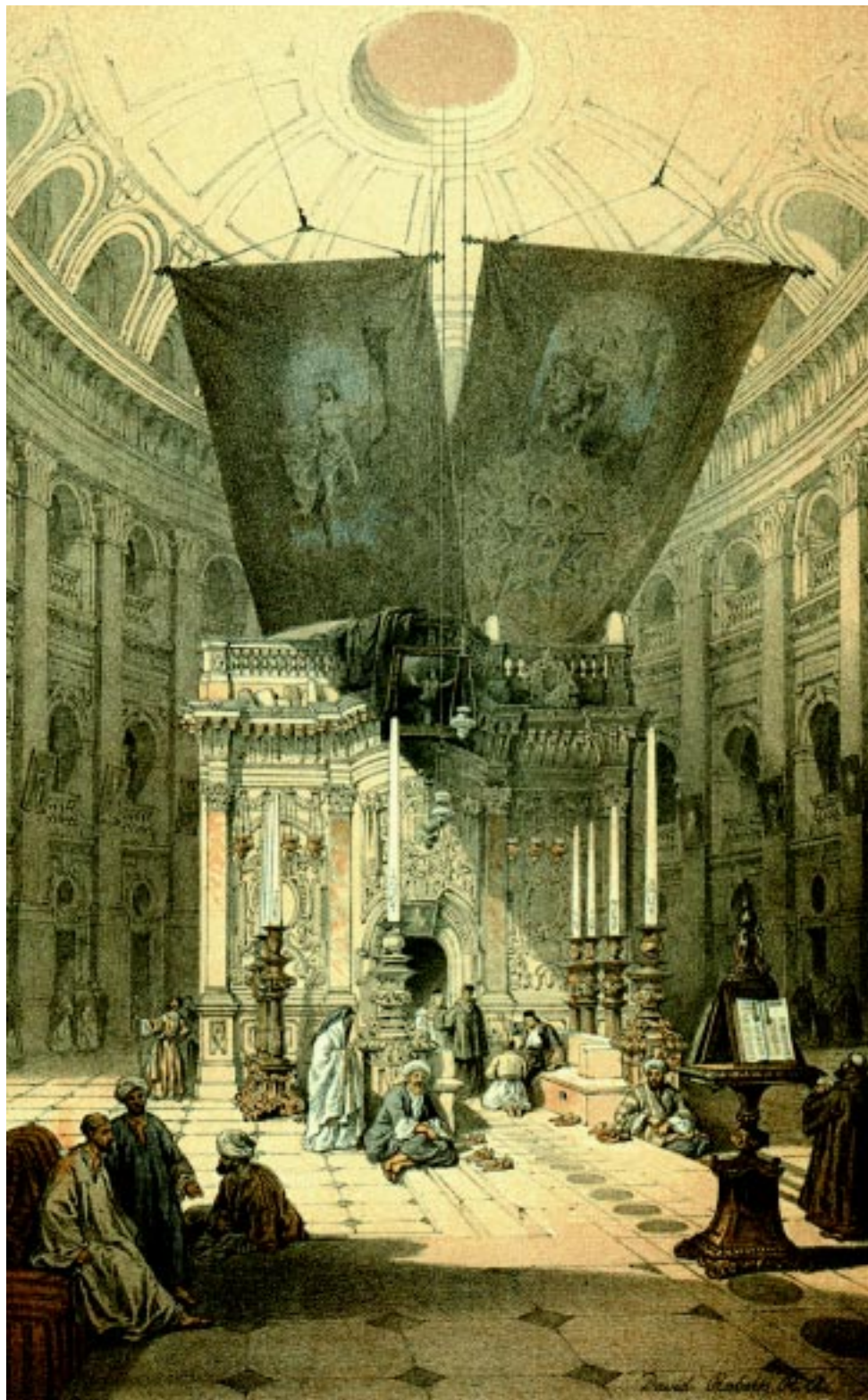
Кувуклия (Усыпальница Иисуса). Литография XIX в.

тых мест. На протяжении двух с половиной сотен лет католики считают, что турецкий указ ущемляет их интересы. Тем не менее, до сегодняшнего дня это единственный письменный документ, на основании кото-