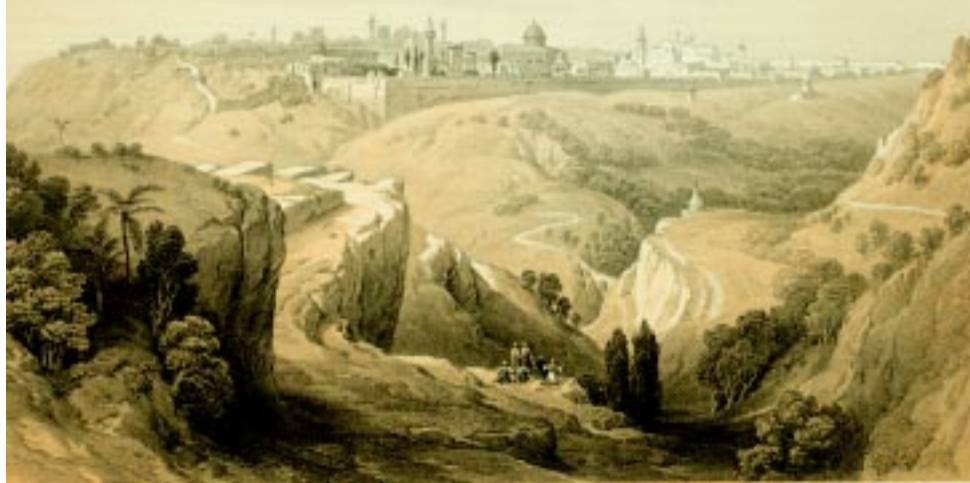
Вид Иерусалима с дороги, ведущей в Вифанию. Литография XIX в.

В последнее время тема Иерусалима привлекла к себе внимание средств массовой информации в связи с кровавыми столкновениями между израильтянами и палестинцами. Нынешняя кризисная ситуация во многом была вызвана начавшимся обсуждением в ходе израильско-палестинских переговоров вопроса о статусе Святого города.