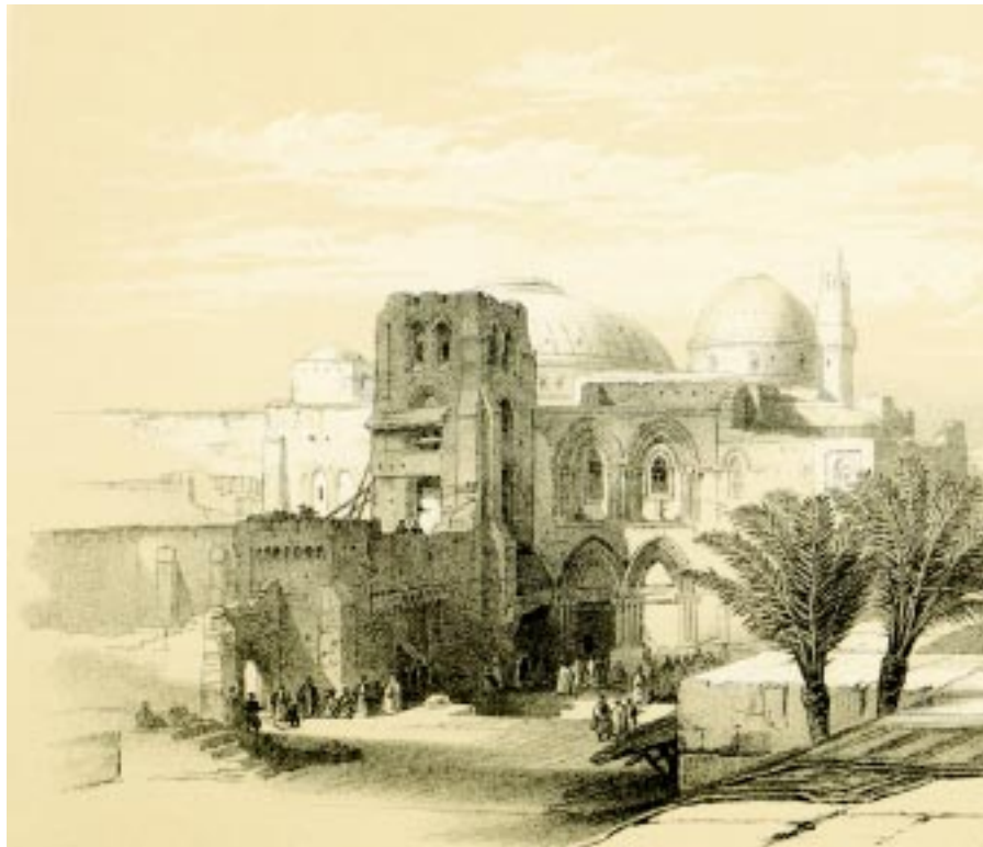
Общий вид Храма Гроба Господня. Литография XIX в.

Захватившие Иерусалим крестоносцы лишили восточных христиан их монопольных прав хранителей христианских святых мест, которыми они обладали со времен Византийской империи. С этого начался не преодоленный по сей день конфликт между восточной и западной церквями за контроль над главными христианскими храмами в Святой Земле. Исторически сложилось так, что интересы православия в нем представляет греко-