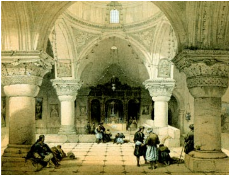
Часовня Св. Елены. Литография XIX в.

В XI в. западноевропейцы уже хорошо знали дорогу в Иерусалим: путешествие в Святую Землю совершали и благочестивые монахи, и простые люди, и знатные сеньоры. В рубежном 1000 г., совсем как в наше время в году 2000-м, Иерусалим испытал нашествие паломников, приехавших из