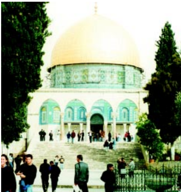
Мечеть Омара (так называемая Куббат ас-Сахра)

в 614 г. персами. Теперь на этом месте небольшое, похожее на беседку купольное сооружение, хранителями которого являются мусульмане, которые так же, как и христиане, чтут вознесшегося пророка Иисуса). Русские православные дали храму ласково-домашнее название «Стопочка».