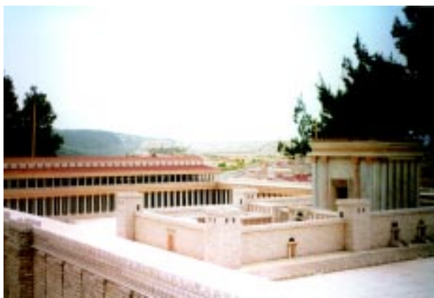
Храм и царский портик. Модель второго иудейского храма, построенного Иродом Великим

В 66 г. н. э. в Иерусалиме произошло крупное антиримское выступление, положившее начало периоду, получившему в истории название Первой иудейской войны. Римляне беспримерно жестоко расправились с мятежными иудеями, так никогда и не примирившимися с их господством. В 70 г. Иерусалим был разрушен до основания, храм сожжен, а его уцелевшие сокровища вывезены в Рим. На обломках красивого и богатого города не осталось ничего, кроме небольшого гарнизонного поселения X римского легиона,