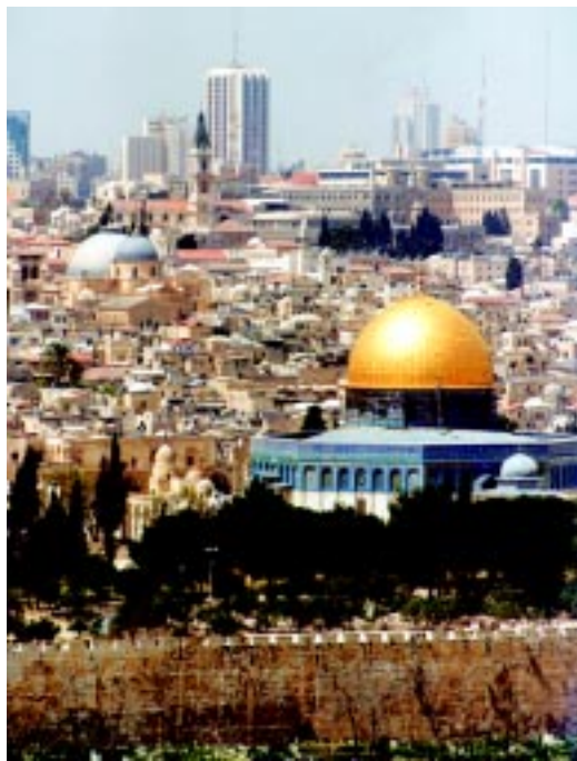
Современный вид Иерусалима

рейское и арабское. На страницах российской прессы промелькнул вариант превращения Иерусалима в столицу всего мира с перемещением сюда учреждений ООН, хотя утопичность такой постановки вопроса в контексте израильско-палестинских отношений и с учетом реалий этого города совершенно очевидна. Ряд стран ЕЭС и Ватикан проводят на экспертном уровне обсуждения различных вариантов статуса святых мест в связи с израильско-палестинскими переговорами по Иерусалиму. Россия, заявляющая о себе в последнее время как о крупнейшей православной державе, продолжает придерживаться своей прежней позиции по Иерусалиму, включающей свободу доступа к святым местам всех трех религий.