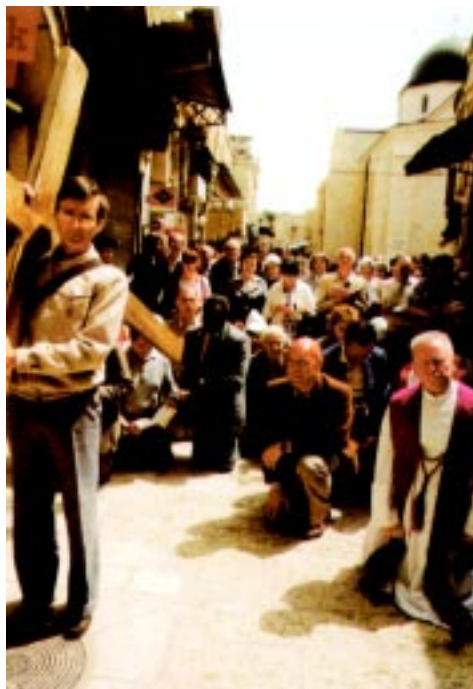
Крестное шествие на Виа Долороса

бога и славившими чуждого им Аллаха и его пророка Мухаммеда.