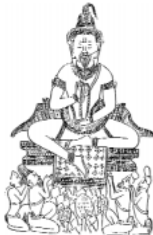
Шива с «китайской бородкой» на барельефе Ангкор-Вата. Прорисовка В.В. Голубева.

ней представлены семь неизвестных ранее скульптур классического ангорского стиля: две буддийские святыни в форме линги 1 с изображением Будды и Локешвары, обнаруженные Голубевым, статуя сидящего на свернувшихся нагах (змеях) медитирующего Будды, две головы статуй Будды, одна — статуи дэва, одна — статуи асура, и деко-