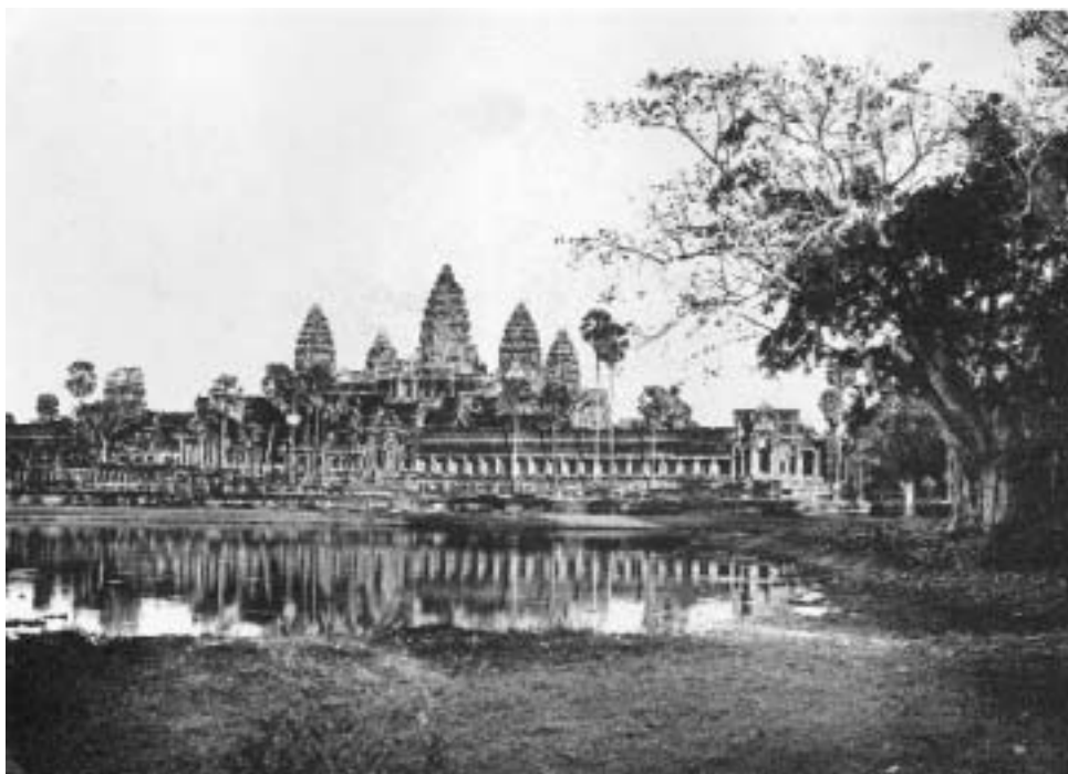
Вид на Ангкор-Ват с южной стороны.