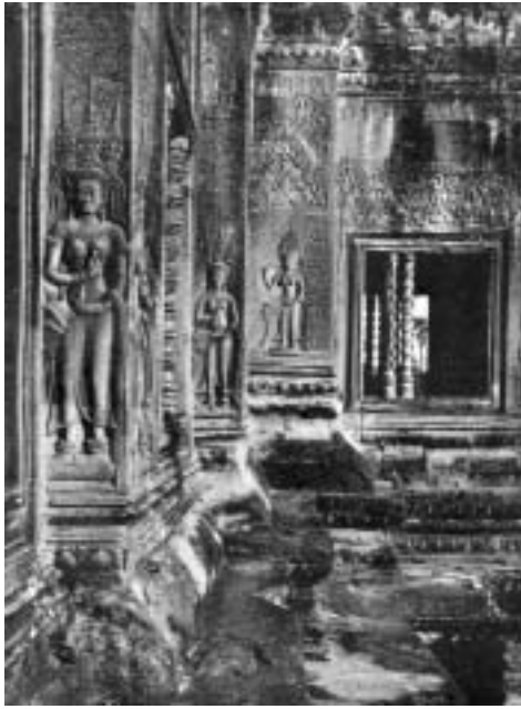
Изображения апсар – небесных фей.

венном возвышении, являлся центром первой ангорской столицы Яшодхарapura.