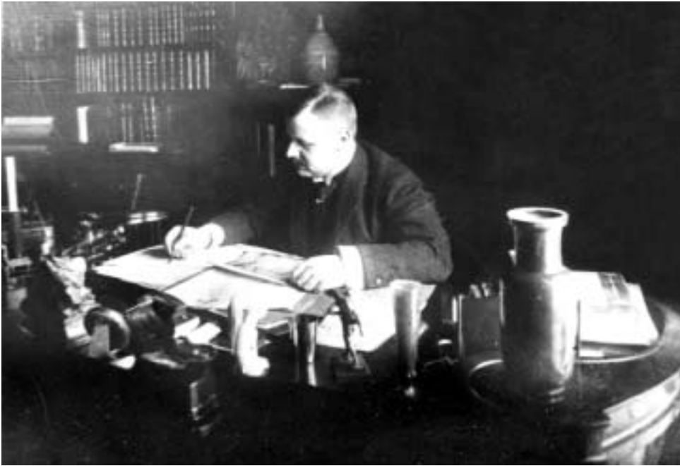
В.В. Голубев в своем кабинете в Париже.

вич Голубев. В истории изучения Ангкора открывается новая страница, связанная с именем этого выдающегося востоковеда.