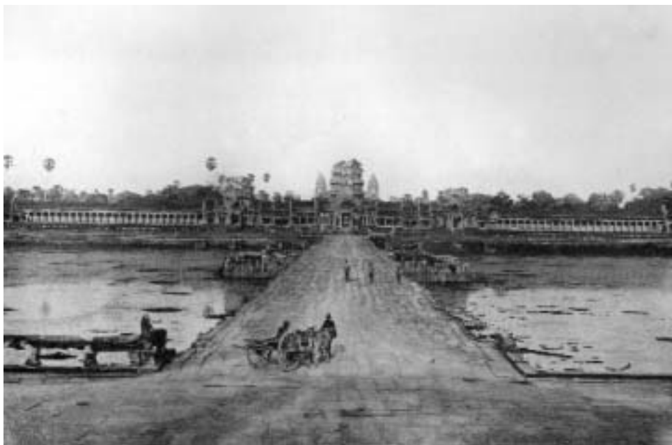
Главный вход в Ангкор-Ват с западной стороны.

родской черты Ангкор-Тхома были раскопаны дамба, канал и отходившие от него, выложенные каменными плитами желоба — остатки гидросистемы Ангкор-Тхома.