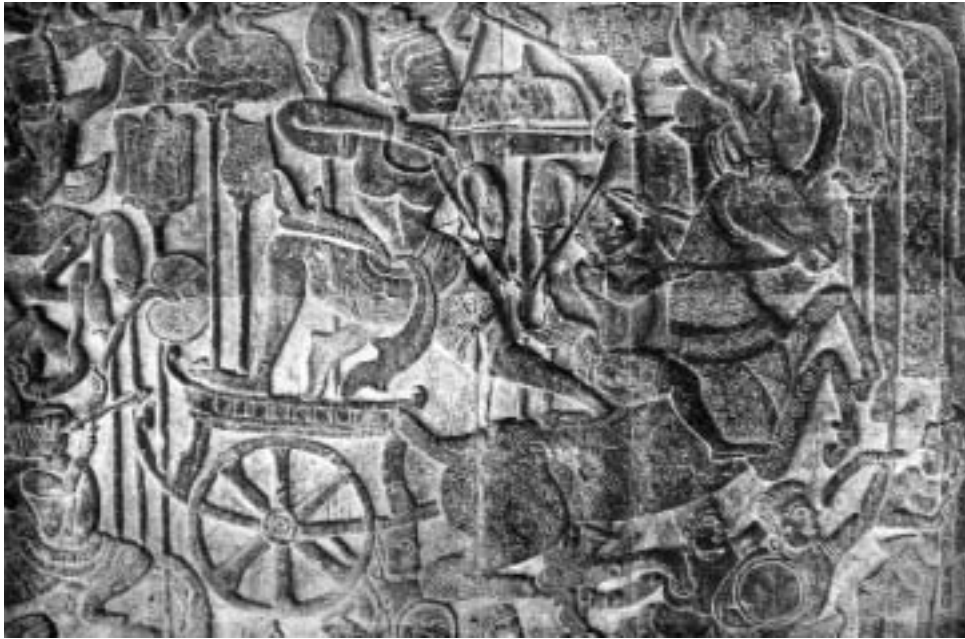
Победа Вишну над асурами. Барельеф из восточной галереи Ангкор-Вата.

башен и галерей храма Байон, восстановлена Аллея Гигантов со статуями 54 дэвов (богов) и асуров (демонов), которая вела от северо-восточных ворот Ангкор-Тхома, столицы кхмерского короля-реформатора Джаявармана VII, к храму Прах-Кхан, построенному в честь его победы над государством Чампа в 1177 г. Осматривая таинственно улыбающиеся лики на башнях Байона, Фино и Голубев предположили, что там изображен бодхисатва Локешвара (санскр. Авалокитешвара). Чтобы проверить свою гипотезу, они отправились в построенный при том же короле Бантеай-Чмар — махаянистский монастырь, по буддийской традиции находящийся под покровительством бодхисатвы Авалокитешвары. На одном из барельефов храма находилось и изображение бодхисатвы, детали которого оказались идентичными «загадочным ликом» Байона. Тем самым было установлено, что Байон — это не шиваитский храм эпохи Яшовармана I (прав. 889–900), как считалось до этого, а буддийский храм, посвященный Бодхисатве-радже . Лики на башнях Байона восходили к Джаяварману VII, жившему три века спустя.