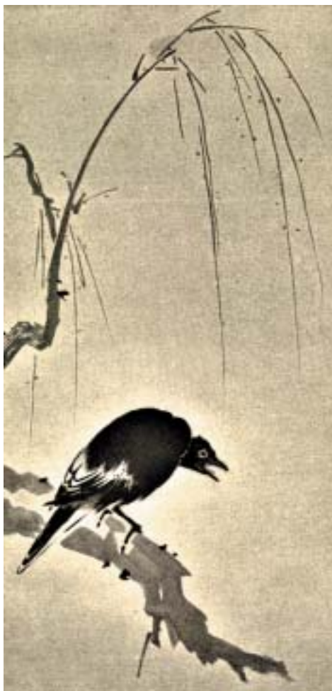
От редакции. Среди птиц, изображенных на стр. 93–95, кукушки нет.

цей, возвещающей приход лета. Лето — это, конечно, не то, что дающая силу всему году весна, но все-таки среди японских поэтов находились и такие, кто по-дружески просил кукушку начать петь еще до наступления лета, склоняя ее тем самым к нарушению устойчивого чередования времен года.