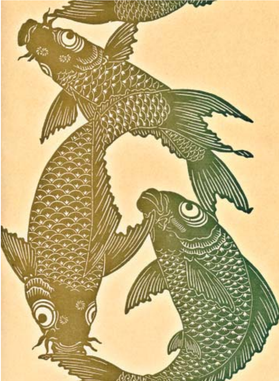
В оформлении материала использованы иллюстрации из старопечатных книг эпохи Эдо из собрания Российской государственной библиотеки и из книги «Artistic Japan: Illustrations and Essays». Collected by S. Bing. – London, 1890.

там разноцветных карпов (белых, красных, синих). Первоначально это было связано с буддийским ритуалом отпущения на волю живых существ. Рядом с прудом обычно можно купить и корм, чем непременно пользуются посетители храмов. Так что японские карпы не только очень красивы, но и отменно упитанны.