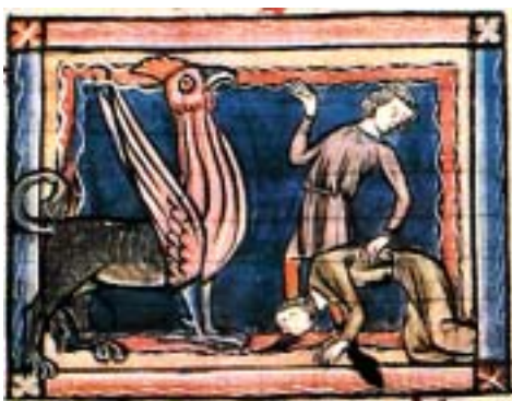
Люди, гибнущие под взглядом василиска. Бестиарий. XII в.

ними представлениями о земле как порождающем чреве. М. Элиаде, размышляя о тайнах вавилонской алхимии, пишет: «Так же как в плавильной печи растет, "зреет" и совершенствуется "эмбрион", в реторте алхимика "усовершенствуется" обычный металл, превращаясь в золото. Одна исходная идея проглядывает за обеими этими операциями — совершенствование в процессе "рождения" и "роста"». Василиски находятся шесть месяцев в подземелье (в могиле) и затем проходят очищение огнем, что равнозначно ритуалу инициации. Это мистический опыт, который передается в терминах «рождения» и «возрождения». Считается, что картина герметического мира насыщена следующими образами: растворение представлено драконом, пожирающим человека; кислоты уподобляются хищникам — льву, орлу и тигру; ртуť — это змей, оплодотворяющий сам себя; превращение змея в дракона с крыльями и лапами символизирует соединение ртути, соли и серы.