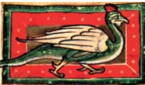
Василиск, или петух со змеиным хвостом. Миниатюра из латинского бестиария XII в. Санкт-Петербург. Библиотека Академии наук.

Кажется, никто из средневековых путешественников не решился говорить о змеепетухе, что косвенным образом свидетельствует о его искусственном происхождении. На это же указывает неустойчивая иконография василиска. Страшное пресмыкающееся встречается только в поздних бестиариях и