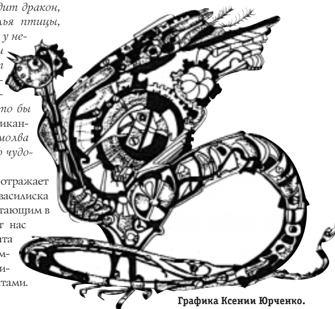
Графика Ксении Юрченко.

История василиска — это история метафоры, литературный казус, вариация на тему Медузы Горгоны. Мощный импульс, заданный античной мифологией, затухая, породил паразитологический сюжет, в котором доминирует тема смерти. Образ василиска — это один из ликов смерти, увидеть который не могут ни люди, ни боги, — это всегда опыт запредельного. Рокковые свойства змеи обеспечили василиску устойчивое место в литературе о чудесах мира, мистических концепциях и алхимических построениях. Фактически речь идет о перекодировке метафоры в различные мифологические сценарии, которые, в свою очередь, трансформируются в ряд бестиарных сюжетов. Так появилась фантастическая змея — посланец иного мира.