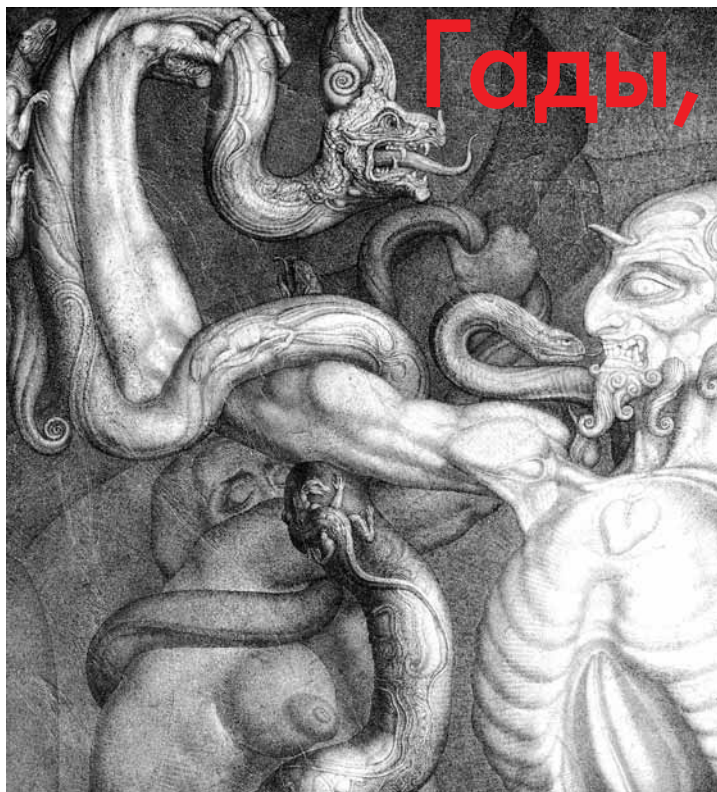
Эрнст Фукс Анти-Лаокоон.

П ротопанные тропы хороши уже тем, что, как правило, вводят нас к жилью, т.е. местам вполне обжитым и знакомым, либо к дорогам, всегда ведущим к жилью. Но есть и такие тропки, что могут, покурлесив, завести в дебри и исчезнуть из-под ног. Приходится признать – проложены они с неведомой для нас или давно забытой целью... И стоит ли пытаться ее найти? Цель, потерявшую смысл.