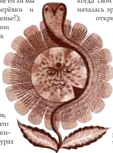
По этой народной картинке сразу видно, что змей в Индии любят.