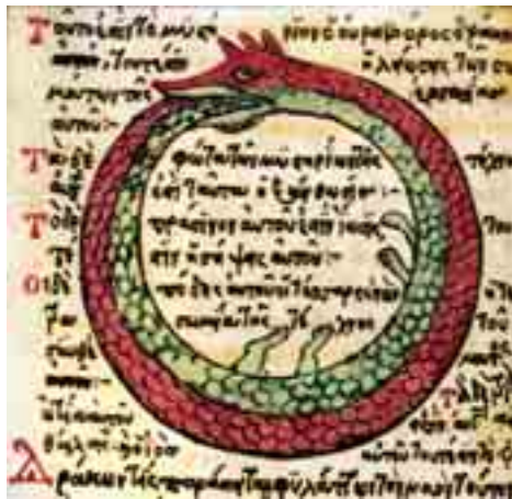
Уроборос гностиков, или змея, пожирающая собственный хвост, – эмблема циклической сущности мироздания. «Сам себя порождает, сам с собой соединяется в браке, сам себя оплодотворяет и убивает» (Дж. Купер).

Существует предание, что еще до появления человека Землю населяла мудрая раса змей. Возможно, отголоски той эпохи сохранились в многочисленных свиде-