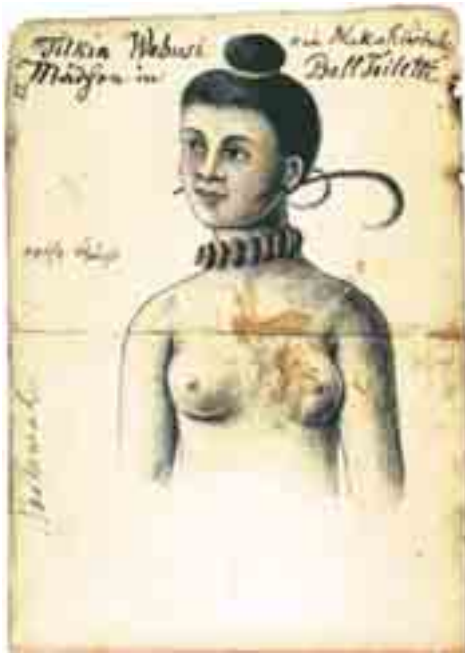
Женщина с о. Нуку-Хива.

ствии писал, что художник-путешественник должен быть одарен «тремя великими способностями»: «совершенным знанием своего искусства и силами осуществлять свой замысел легко и верно, умением правильно выбирать объекты для изображения и, наконец, фантазией», которой, тем не менее, всегда следует находиться «под строгим руководством беспристрастного взгляда». И далее: «Все имеет свой особый образ, и надо несомненно уметь выделить эти природные черты; даже если художник будет обладать талантами Рафаэля, но при этом наделит китайцев красотой греческих героев, то каким бы совершенным ни казалось его творение, оно все равно не сможет притязать на истинное изображение данного народа».