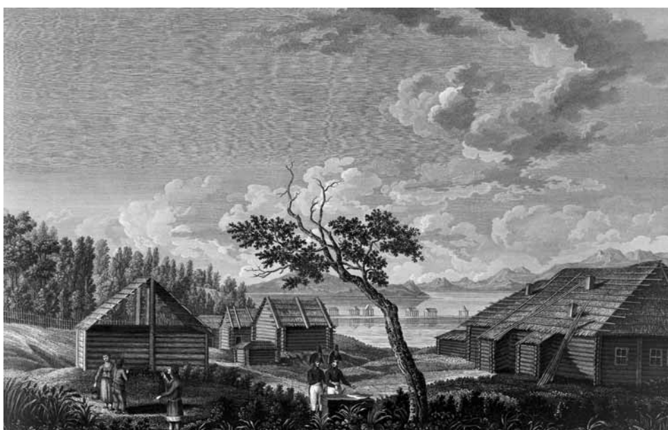
Петропавловск-Камчатский в начале XIX в.