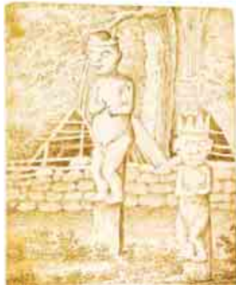
Морай на о. Нуку-Хива (рисунок из альбома Тилезиуса и гравюра по этому рисунку).

Можно только удивляться, как за краткое время стоянки у острова (всего 10 дней!) мореплавателям, даже при помощи «толмачей», удалось так много узнать об укладе жизни местного населения. Несомненную историко-этнографическую ценность представляет сделанная для «Атласа» по рисунку Тилезиуса гравюра «Вид моря» — святилища и одно-