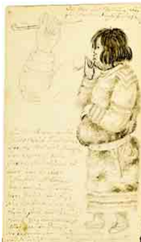
Айн, курящий трубку.

кая часть сего путешествия, но в художественном отношении всегда будет иметь свою цену богатым и любопытным Атласом, приложенным к оному, и которым я обязан единственно трудам г-на Тилезиуса».