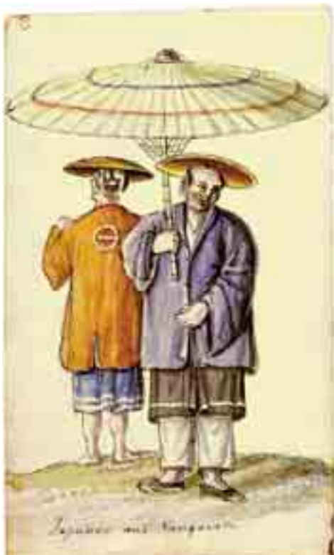
Жители г. Нагасаки.

вана рядом гравюр, подготовленных П.И. Масловским по рисункам Тилезиуса и «под смотрением» И.-С. Клаубера.