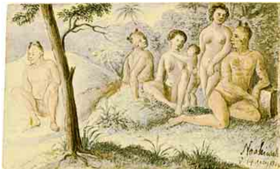
Жители о. Нуку-Хива.

«Атлас» и поныне не потерял своего научного и художественного значения, прежде всего благодаря рисункам, в которых натуралист запечатлел важнейшие этапы плавания.