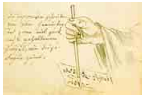
Способ письма у японцев.

Успех как морской, так и научной частей экспедиции был предопределен тем, что эки-