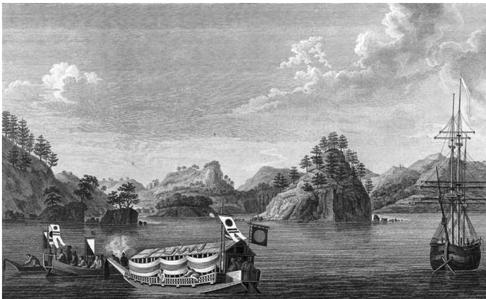
Вид острова Папенберга и Крысьи острова.

Разумеется, Крузенштерн понимал, что особую ценность «Атласу» придало бы «объяснение каждого из листов иллюстраций», особенно если бы этот труд взял на себя сам их автор. Но это намерение так и не осуществилось. На момент выхода в свет «Атласа» труды Тилезиуса по результатам экспедиции еще не были переведены на русский язык. Полностью они так и не были изданы по-русски. Перевод ряда статей был опубликован лишь в «Технологическом журнале» и в