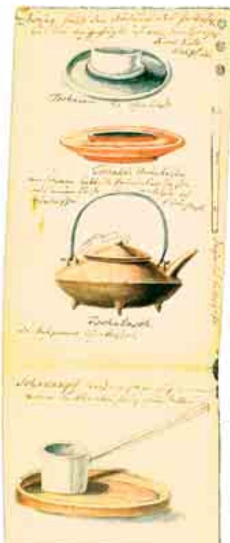
Японская домашняя утварь.

Европейским художникам конца XVIII в., находившимся под влиянием модного тогда стиля барокко, а также представлений об идеале, соответствующих нормам античного искусства, весьма тяжело давались изображения островитян Южных морей. Художники — участники английских и французских кругосветных экспедиций, вдохновленные рассказами о «естественной простоте», «прекрасных островах» и «благородных дикарях», зачастую рисовали местных жителей на фоне идиллических пейзажей, одетыми в пышные одеяния и нередко даже наделяли их греческим профилем. Не избежавший подобных увлечений англичанин У. Ходжс, участник второго путешествия Дж. Кука, впослед-