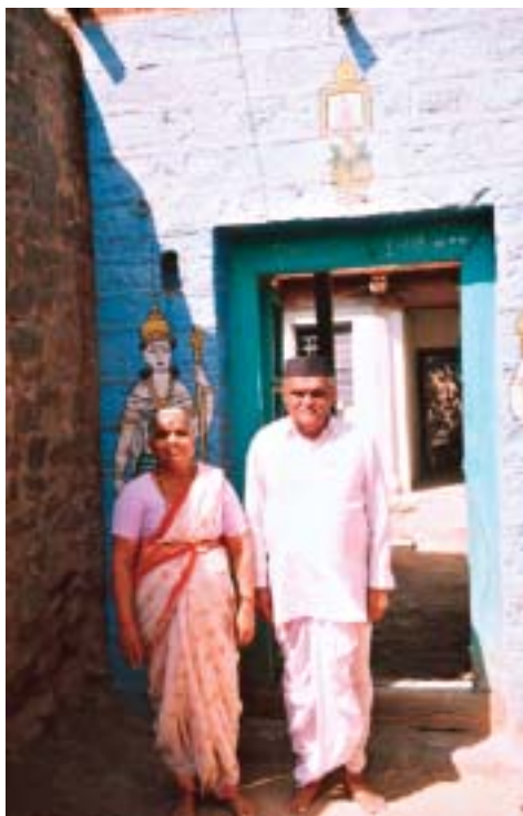
Механизм браков регулируется старшим поколением.

знает самоограничений. Человек является человеком потому, что способен к воздержанию, и остается человеком лишь постольку, поскольку на практике осуществляет это воздержание. Если раньше восхваление брахмачарии в наших религиозных книгах казалось мне нелепым, то теперь с каждым днем все яснее представляется совершенно правильным и основанным на опыте. Кстати, эпитет «махатма» — «великая душа», заменивший со временем личное (Мохандас Карамчанд) имя Ганди, первоначально использовался для обозначения того, кто устоял против женских чар.