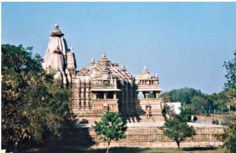
Храм в Кхаджурахо.

(кстати, настоящая красавица должна была обладать и походкой слона). Впрочем, таков был идеал: грудь высокая, пышная и такая горячая, что упавшие на нее капли воды моментально испаряются, талия — тонкая, но на животе наличествуют три ниспадающие складки, пупок — бездонный, а под ним вьется дорожка волос, ведущая к треугольнику любви. Поскольку все эстетическое было и этическим, то обладание подобными физическими достоинствами подразумевало и безупречность характера. Так что неудивительно, что все разговоры оставались на потом.