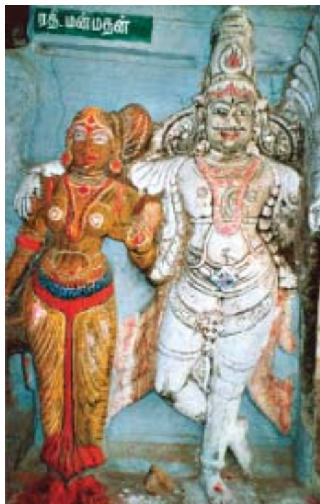
Кама и Рати. Храмовая фреска.

или когда новобрачных по очереди омывают и они обрызгивают водой друг друга и подружек и дружков, неотступно следующих за ними; или когда жених крепко зажимает в кулаке семечко супари, а невеста изо всех сил старается разжать ему пальцы; или когда жених держит в зубах свернутую из табачных листьев трубочку либо продолговатый кусочек кокосовой копры, а смущающаяся невеста своими зубками пытается ухватиться за виднеющийся кончик и выдернуть их, или когда подружки невесты прячут в складках ее одежды то же семечко супари, а жених дотрагиваясь до тела суженой пытается его обнаружить.