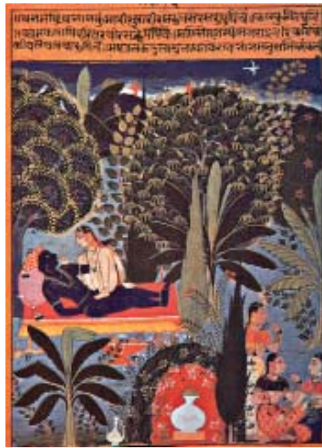
Кришна и Радха в роще.

торых наиболее популярной считается аватара любвеобильного пастуха Кришны. Прodelки Кришны, в частности его забавы с влюбленными в него пастушками, запечатлены в ставшей сакральной «Бхагават-пуране» и послужили источником вдохновения для множества авторских произведений. Джаядева, поэт из Бенгалии, воспевавший в XII в. неумную потенцию Кришны, из огромного сонма (16 000!) пастушек выделил Радху, ставшую с того времени самой любимой подругой бога. Повествование об их взаимоотношениях — с ревностью и ссорами, разлуками и последующими соединениями — может прочитываться двояко: как эротический гимн и как аллегория союза между человеческой душой и божественной.