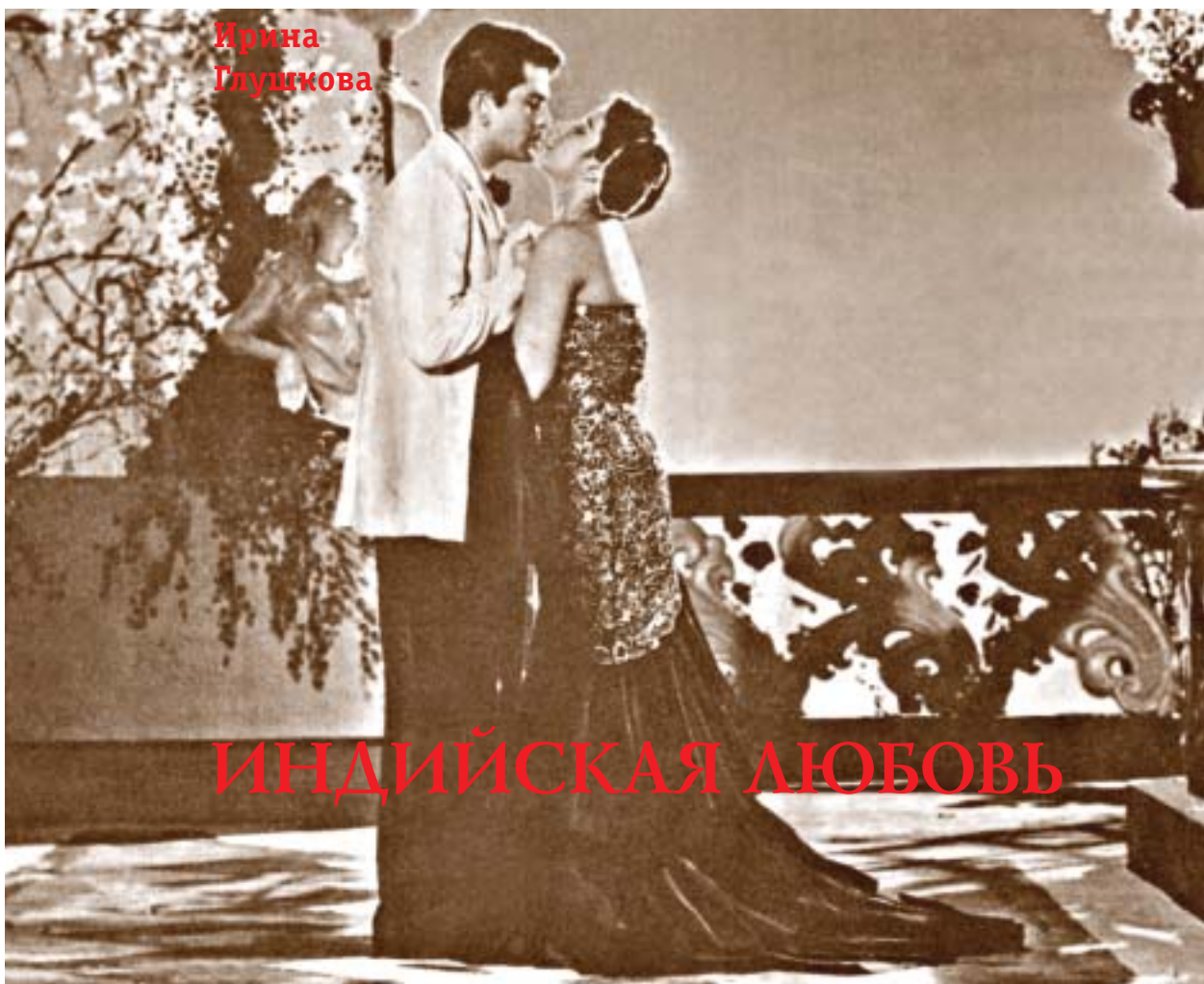
Трогательная сцена из знаменитого фильма «Бродяга».