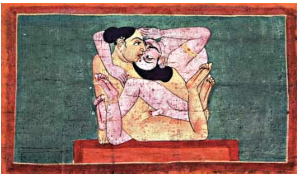
В оформлении статьи использованы иллюстрации из книги: Ramson P. Tantra. The Indian Cult of Ecstasy. – Delhi, 1973, и из журнала «Orientations».