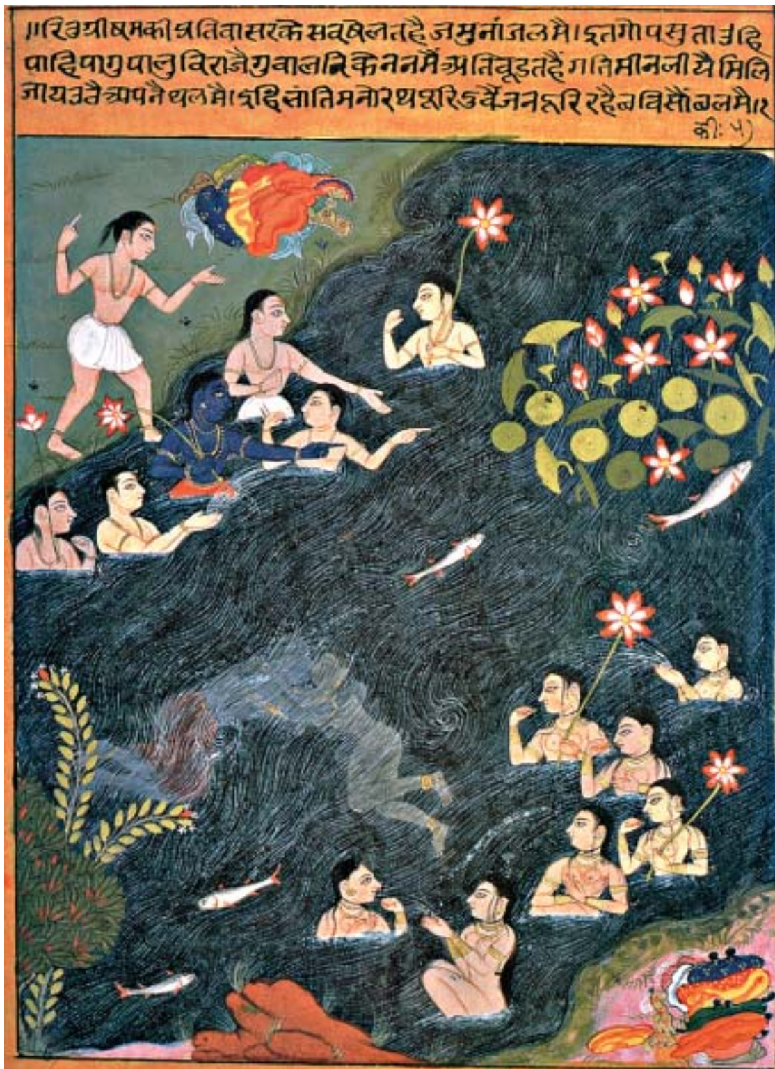
Кришна и Радха украдкой целуются под водой.

действующие в романе царевичи прекрасны уже своим высоким происхождением). Наряду с безупречностью уже описанных выше деталей, дама должна была обладать не очень мускулистыми голенями, шиколотки не должны выделяться, линия ляжек