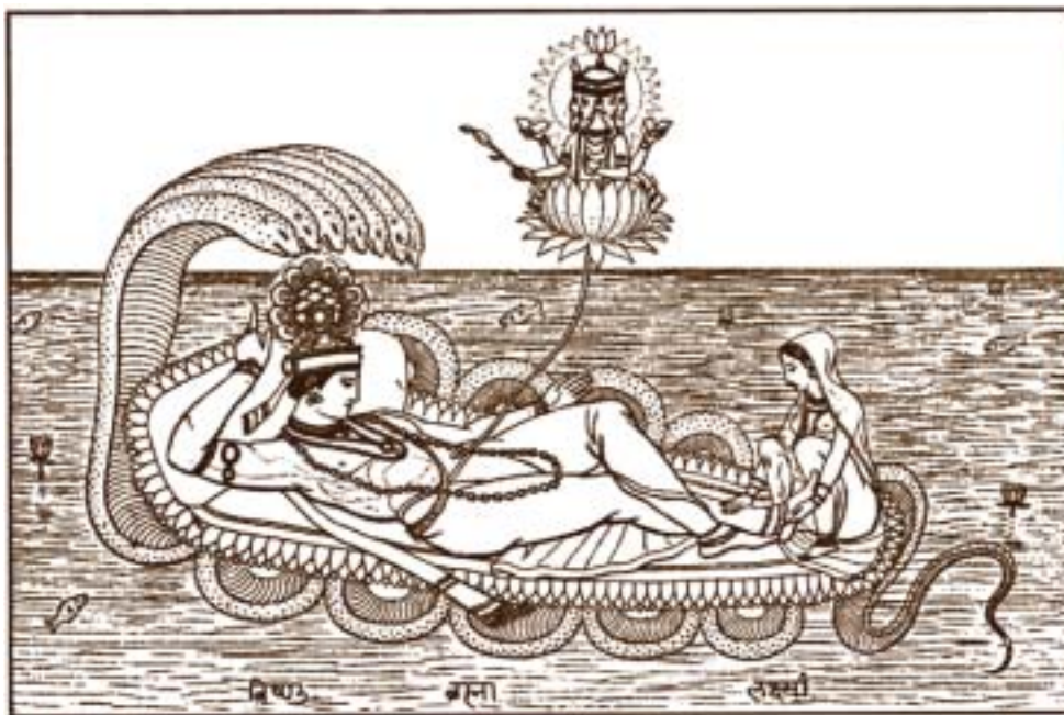
Вишну и его супруга Лакшми.

тарупа, у Брахмы немедленно отрастала голова, глядящая в том же направлении. Когда же уставшая от недвусмысленных намеков Сатарупа воспарила ввысь, у Брахмы появилась и пятая голова, следящая за полетом дочери. Инцест все-таки состоялся, весь божественный народ дружно пришел в ужас, а разгневанный Шива в наказание отрубил родителю-растлителю одну из пяти голов. Хотя пураны (собрания священных мифов) объясняют, что «смертные, видящие все происходящее глазами из плоти, не могут обсуждать поступки богов», считается, что именно из-за недостойного поведения Брахмы индийцы ему не поклоняются. Четырехглавые изображения можно встретить на храмовых барельефах, но во всей Индии остался только один весьма скромный храм, непосредственно посвященный Брахме. Он находится возле священного озера Пушкар в Раджастане.