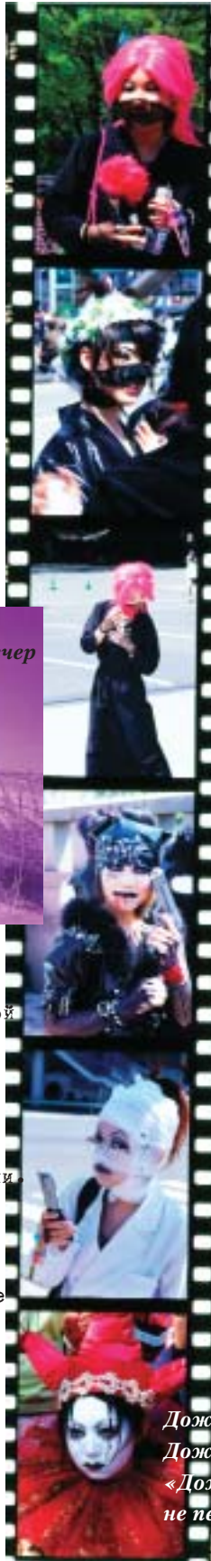
«Холодно» – когда б ты сказала я, «Холодно» – мне в ответ говорящего Теплота

За столом в аромате кофейном – эта чертова жизнь, где помимо любви больше нет ничего.