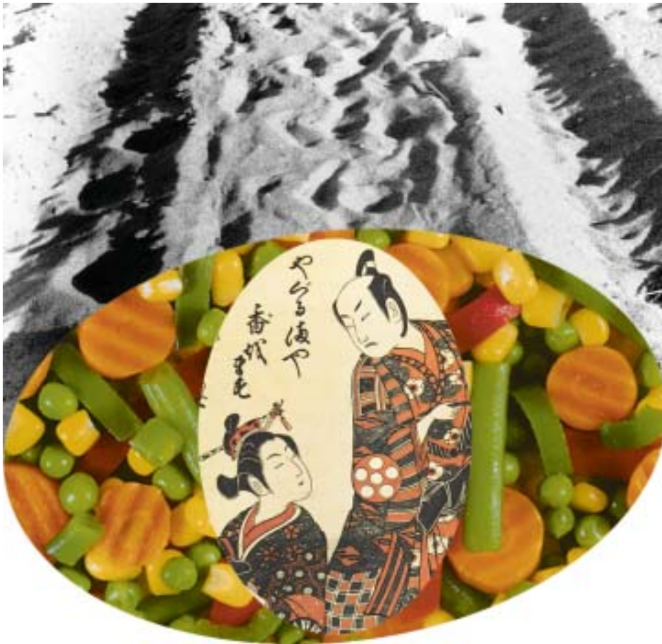
В оформлении материала использованы работы Андо Хиросигэ, Тории Киёхиро, Исикава Тоёнобу, Кацукава Сюнэй.

Вот на этом простимся... Вечер единственного вопроса – и единственного ответа