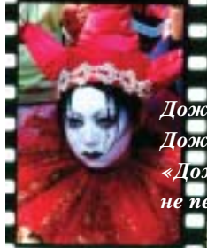
Дождаться – кого? Дождаться – чего?.. «Дождаться» – глагол, никуда уже не переходный.

На твое «все в порядке!» не поняв что в порядке Киваю.