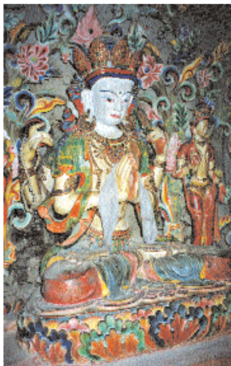
Авалокитешвара – бодхисатва милосердия и сострадания.

Мустанга очень популярен бодхисатва Манджушри, почитаемый как божество мудрости. Настоятель объясняет: «О том, что перед вами образ Манджушри, свидетельствуют пламенеющий меч и священная книга, которые этот бодхисатва держит в руках. Огненным мечом он рассекает невежество». Дхармапалы – божества-охранители.