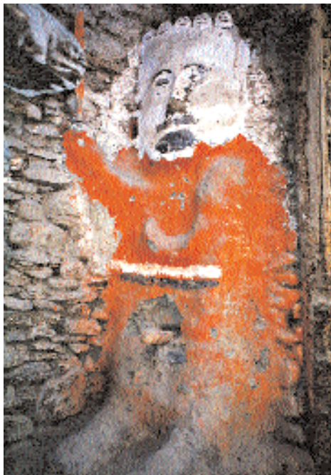
Местное архаичное божество.

Над всеми городками Мустанга доминируют монастыри-крепости с красными стенами. На крышах молелен обязательно находится изображение чакры – колеса учения, которое поддерживают два оленя. То тут, то там встречаются ступы – своеобразные па-