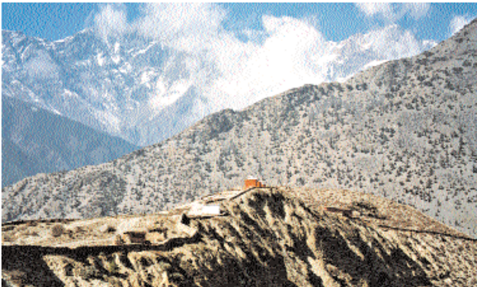
Горный монастырь обнесён каменной стеной.