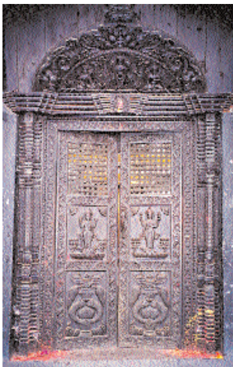
Врата с изображением восьми счастливых символов, ведущие в храм Муктинатх.

месте с большим овечьим стадом. Овцы, как им и положено, стали бестолково топтаться на месте, полностью перекрыв проход и проезд. Пастухам потребовалось минут пятнадцать, чтобы увести стадо.