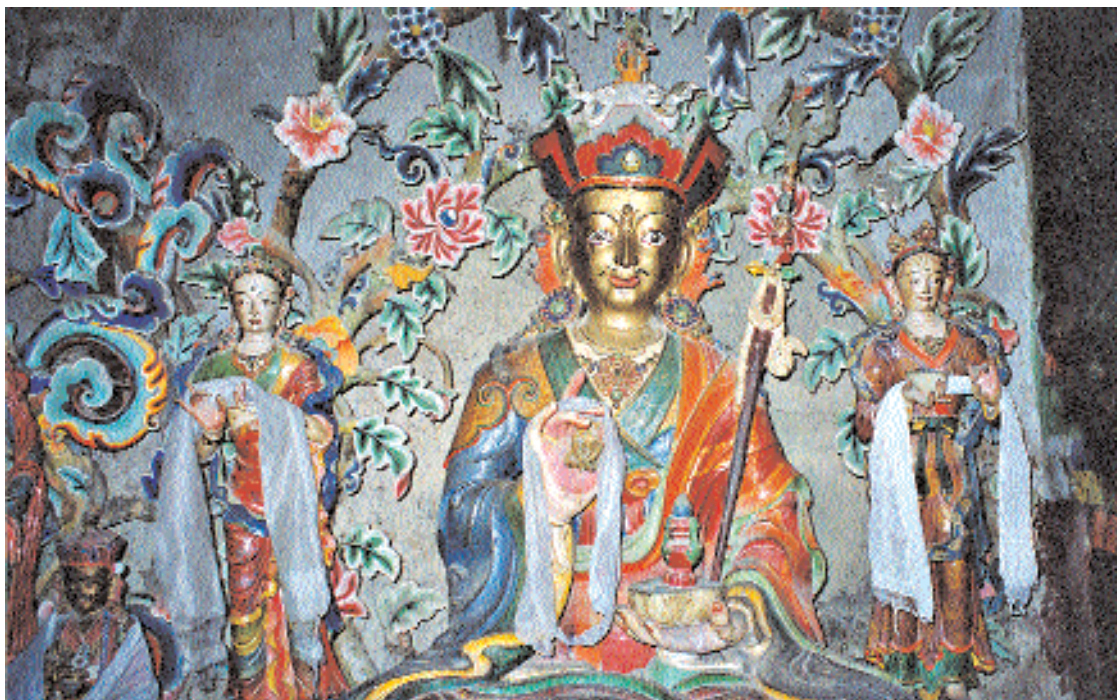
Гуру Ринпоче, основатель буддийской школы ньянгмапа.

хары отлично видна и знаменитая Аннапурна, названная так в честь богини изобилия и плодородия. Где-то там, за сверкающими снегами и льдами пиками, – Мустанг.