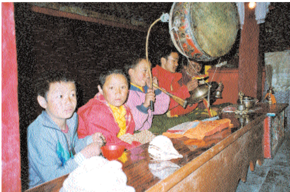
Среди послушников-музыкантов – совсем маленькие дети.

чале пути произошел курьёзный случай. На выходе из Джомсома тропа оказалась заблокированной большим овечьим стадом. Автомобили по причине отсутствия дорог здесь отсутствуют. Однако в Джомсоме есть трактор с тележкой, на которой туристов доставляют в пятизвездочную гостиницу. Так вот, этот трактор встретился в узком