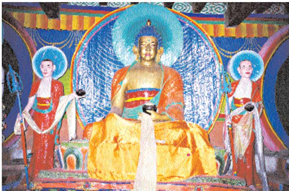
Будда Шакьямуни Гаутама с учениками.

и внутри я не ожидал увидеть ничего особенного, но ошибся. По полутёмным коридорам я пробрался в глубь монастыря. В модельне, скупо освещённой светом, который проникал через расположенные под самым потолком узкие окошки, шла служба. Ламы и послушники читали монотонными голосами мантры. Молитвы то и дело прерывались оркестром, состоящим из барабанов, флейт, длинных труб и больших белых раковин. Среди послушников-музыкантов были совсем маленькие дети. Они усердно дули в дудки, смешно надувая щеки. В каменном помещении холодно, поэтому ламы были в шерстяных варежках. Приглядевшись, я увидел, что святилище богато украшено яркими настенными росписями, многочисленными статуями будд, бодхисатв, божеств необъятного тибетского буддийского пантеона, иконами-танка на хлопковой ткани.