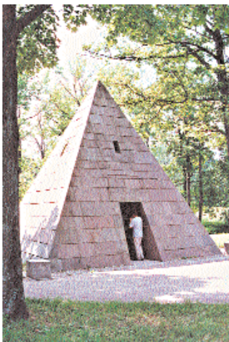
Пирамида в парке Царского Села.

ется, не только сравнительно малым числом выявленных к тому времени памятников (лучшие произведения скульптуры и живописи оставались неизвестными), не только отсутствием исторического подхода, но и политической ориентацией авторов, стремящихся показать, что искусство может развиваться только при условии свободы и независимости, – отмечал советский египтолог И.С. Кацнельсон. – Примером служила, по их мнению, Греция».