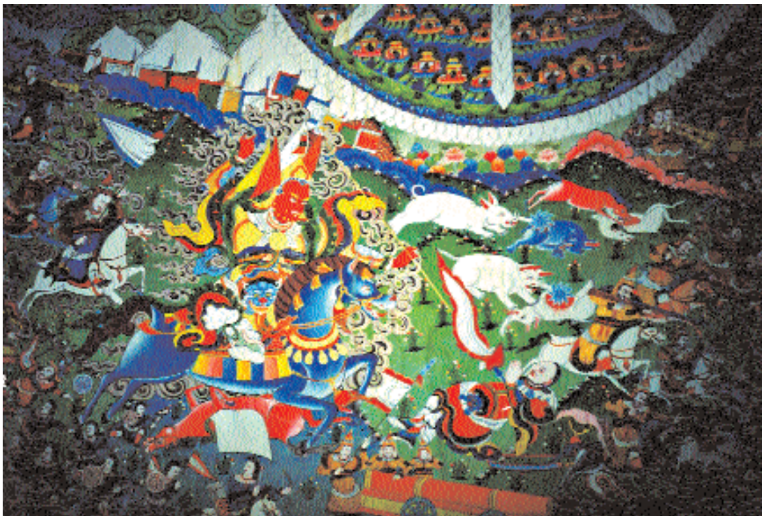
Ригдан XXV Драгбо Хорложан поражает вероучителя лало. Фрагмент танка «Шамбалинская война». Тибет, монастырь Гумбум. Вторая половина XX в.

На Джамбудвипе существуют пять великих священных буддийских мест. Пространство Джамбудвипы организовано по принципу мандала , где выделены одна центральная позиция и четыре – по кардинальным сторонам света. В центре – Бодх-гая, или Ваджрасана (Индия, штат Бихар) – место, где Будда Шакьямуни достиг Пробуждения. На востоке – гора Утайшань (Китай, провинция Шаньси) – место рождения и пребывания