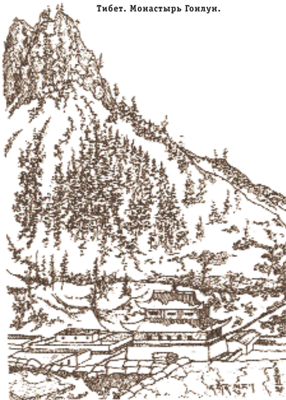
Тибет. Монастырь Гонлун.