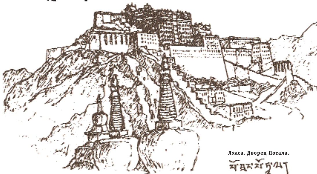
Лхаса. Дворец Потала.