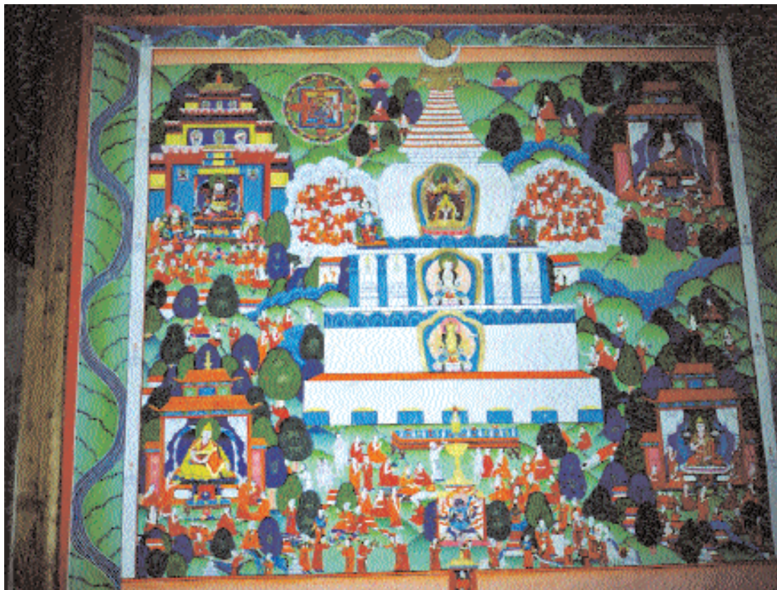
Ступа Шри Дханьякатака, у которой была проповедана Калачакрагантра. Танка. Тибет, монастырь Гумбум. Вторая половина XX в.

Бодхисаттвы мудрости Манджушри. На юге – затерянный в океане остров Потала – место пребывания Бодхисаттвы сострадания Авалокитешвары. На севере – страна Шамбала, где правят цари-ригданы и распространено учение Калачакра. На западе – страна Отияна, или Уржан (предположительно в северо-восточном Афганистане), которую населяют дакини – девы-небожительницы. Считается, что даже при разрушении мира в конце махакальпы (мировой цикл от возникновения мира до его гибели) эти пять священных мест останутся несокрушимыми. Из них общедоступными являются сейчас только два – Ваджрасана и Утайшань. Потала, Отияна и Шамбала доступны только буддийским йогинам высокой степени реализации.