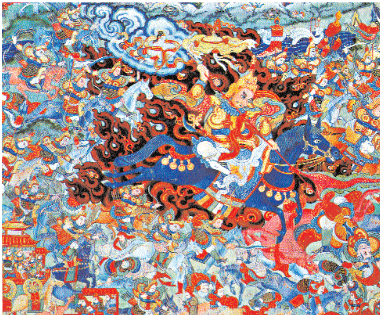
Шамбалинская война. Фрагмент танки «Шамбала» из собрания Международного Центра Рерихов.

Дворец царей Шамбалы, расположенный в центре Калапы, состоит из всевозможных драгоценностей, испускающих яркий свет. Рассказывается о различных чудесных свойствах дворца, о тронах правителей Шамбалы, об их одежде и украшениях, об окружении царей, их утвари и богатствах.