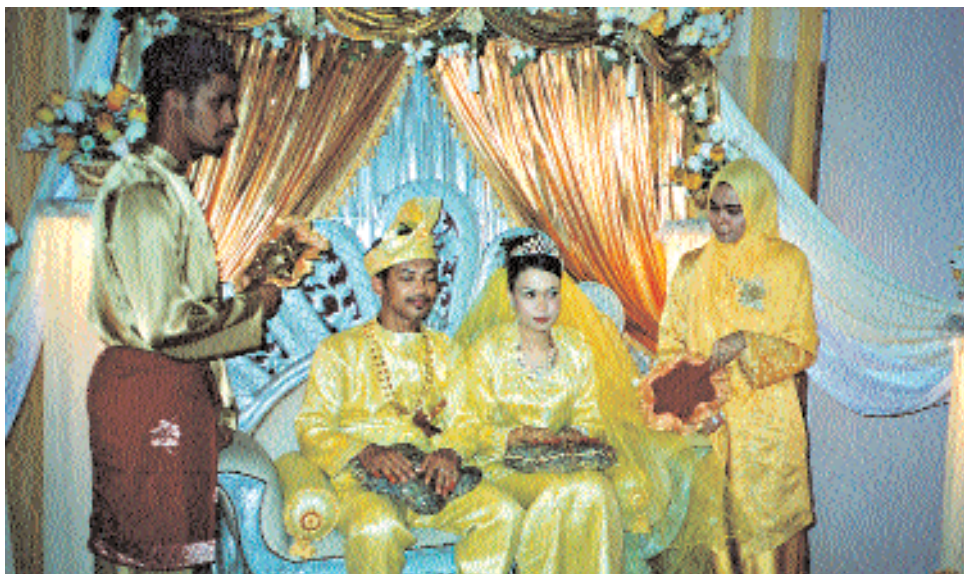
Такие вот свадьбы...

ся помолвленными, и жених должен подарить невесте кольцо, иногда вместе с другими подношениями в виде предметов женской одежды. Если помолвка расстраивается по вине невесты, то подарки возвращаются, если же из-за жениха, то остаются у девушки.