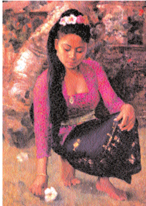
Таков идеал яванской красавицы в представлении художника Даллаха (1919–1996).