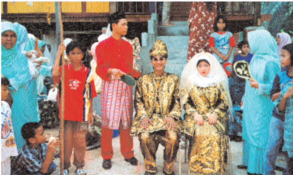
И такие тоже... Другое фото автора.

и завязанный таким образом, чтобы один или несколько углов выступали вверх. Сзади за поясом – семейная реликвия крис , кинжал с лезвием длиной от 30 см, обычно волнообразной формы. Ножны должны быть обращены влево (женская сторона), а рукоять – вправо (мужская сторона).