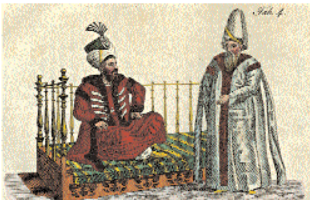
Великий везир на приёме у султана.

подумать, – замечал французский писатель Теофиль Готье, побывавший в Турции в середине 19 в., – что на Востоке живут только мужчины, а женщина – это некое мифическое создание, причём здешние христиане в этом смысле от мусульман не отличаются». Тем не менее, приняв в целом местный наряд, немусульманки позволяли себе оставлять открытым лицо, надевая яшмак – платок, верхняя часть которого закрывала лоб, а нижняя – рот и подбородок. Иногда они просто накидывали на волосы шаль – перекрещиваясь, она завязывалась сзади узлом. Ферадже у мусульманок были зелёного, синего, красного цветов, у христианок – более тёмные. Зелёный цвет считался запретным для «неверных». Армяне, греки и евреи Стамбула носили, как правило, чёрную или тёмную обувь, тогда как и турки и турчанки предпочитали ярко-жёлтый цвет, за исключением богословов-улемов, которым полагались голубые туфли, и некоторых категорий военных, носивших красные сапоги. Герой сочинения «Нешастныя приключения Василья Баранщикова, мещанина Нижнего Новгорода, в трёх частях света... с 1780 по 1787 г.», пленник, насильно обращённый в ислам и зачисленный в янычары, замыслив побег из Стамбула на родину, зашёл к знакомому греку и, «скинув с себя красные турецкие сапоги, обулся в греческие чёрные».