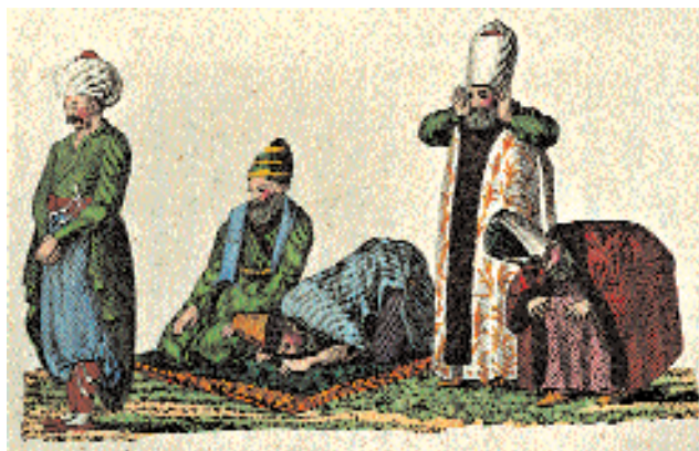
По одежаниям видно, что это люди разного социального положения.

озных авторитетов и придворных. Так, тюрбан великого везира – первого лица в государстве после султана – отличался огромным размером и пирамидальной формой. Он был полностью обёрнут куском материи такой длины, что из него можно было бы сшить платье. В торжественные дни это сооружение украшалось перьями и бриллиантами. Кызлар-агасы – глава чёрных евнухов, распоряжавшийся жизнью гарема и личной казной султана, носил высокий драповый колпак и широкое одеяние из зелёного атласа, отороченное мехом. Подчинённым ему евнухам полагался похожий головной убор менее внушительных размеров, длинное платье с разрезами, передние полы которого затыкались за пояс для свободы передвижений. Дворцовая стража ( бостанджилар ) носила красные фетровые или войлочные колпаки, а сопровождавшие падишаха на процессиях солаклар (лучники) украшали свои головные уборы высокими плюмажами, закрывавшими лицо государя от взглядов толпы. Парадные одеяния османских высших чинов и самого падишаха шились с ложными рукавами – именно их следовало целовать в знак почтения нижестоящим во время дворцовых це-