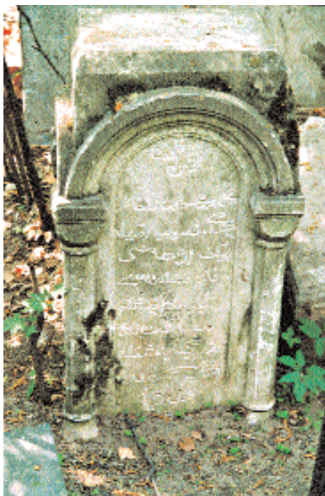
Могила мусульман на Даниловском кладбище в Москве.

Руководитель похорон спрашивает присутствующих: хорошим ли был этот человек на земле, хорошо ли жил, и все отвечают: «Хорошим человеком был, хорошо жил». Перед захоронением муллы, как правило, читает 36-ю суру Корана «Йа син», в которой говорится о всеилии Бога, о рае, аде, посмертном воздаянии, воскресении из мертвых. В могилу опускают только самые близкие люди (в идеале опу-