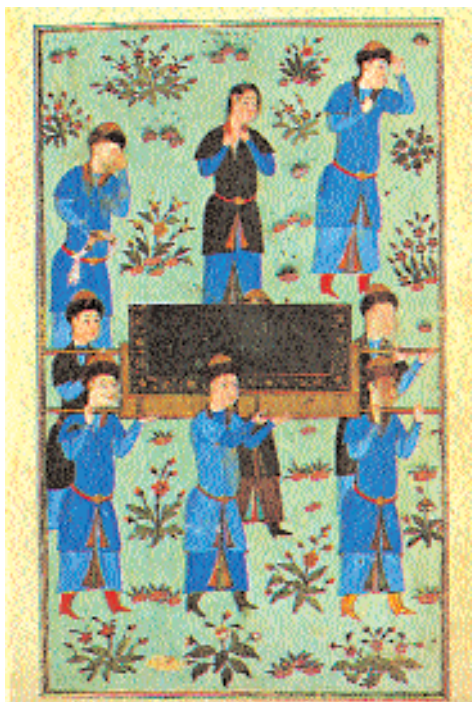
Участники похоронной процессии несут носилки – табут. Миниатюра из «Искандер-наме» Ахмеда. XV в.

Община московских мусульман в религиозно-догматическом плане была достаточно однородна – абсолютное её большинство составляли сунниты, и до начала XX в. шииты существовали независимо от суннитского большинства. Вопрос о шиитах в Москве в эпоху Средневековья и Нового времени требует отдельного рассмотрения. Многочисленные и влиятельные персидские шиитские общины существовали и в других русских городах, более всего известна персидская община Астрахани. Много персов издавна жило и в Москве.