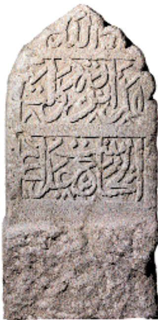
Надгробие. Золотая Орда, Крым. XIV в.

Шариат, как известно, не одобряет сооружения надмогильных надстроек и всякого рода украшений на могилах (кроме посадки деревьев и кустарников). Однако обычай допускает установку плиты с именем покойного, датами его рождения и смерти, тахлилем , аятами из Корана и т.д. Обычно надпись на надгробии состоит из преамбулы – тахлиль («Нет божества кроме Бога, а Мухаммад пророк его!»), нередко добавляется какой-нибудь стих из Корана или просто арабское لله – «Он», (т.е. Бог). Формуляр начинается словом قبر (араб.-тюрк. – «могила»), далее – имя и социальное положение (напр. مولا – «мулла», или زوج – супруга); затем – год цифрами и татарское окончание порядкового числительного, затем татарское ف ١٤ «в году»; название месяца и его число с аффиксом местного падежа ف (может быть, и без числа); далее возраст покойного цифрами и слово ف ٤٧ «в возрасте».