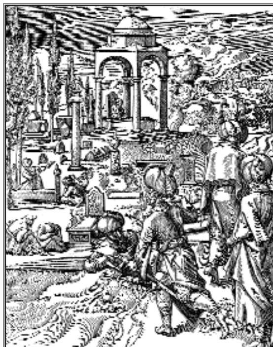
Похороны в Турции. Гравюра из собрания

Погребальный обряд – одно из самых закрытых для иной этнорелигиозной среды действий. Неудивительно поэтому, что ещё в средневековом христианском мире исламский погребальный обряд обрастал легендами и мифами, не имеющими никакого отношения к действительности. Например, флорентинец Лионардо ди Никколо Фрескобальди в записках о путешествии в Святую Землю (1384) отмечал: «В Ламехе [имеется в виду Мекка. – И.З.] тело Магомета, к которому они идут на поклон, как мы ходим ко Святому Гробу; и говорят, что церковь, то есть стены, кровля и пол, – из магнита; поскольку же магнит притягивает железо, они поместили, исчислив всё в точ-