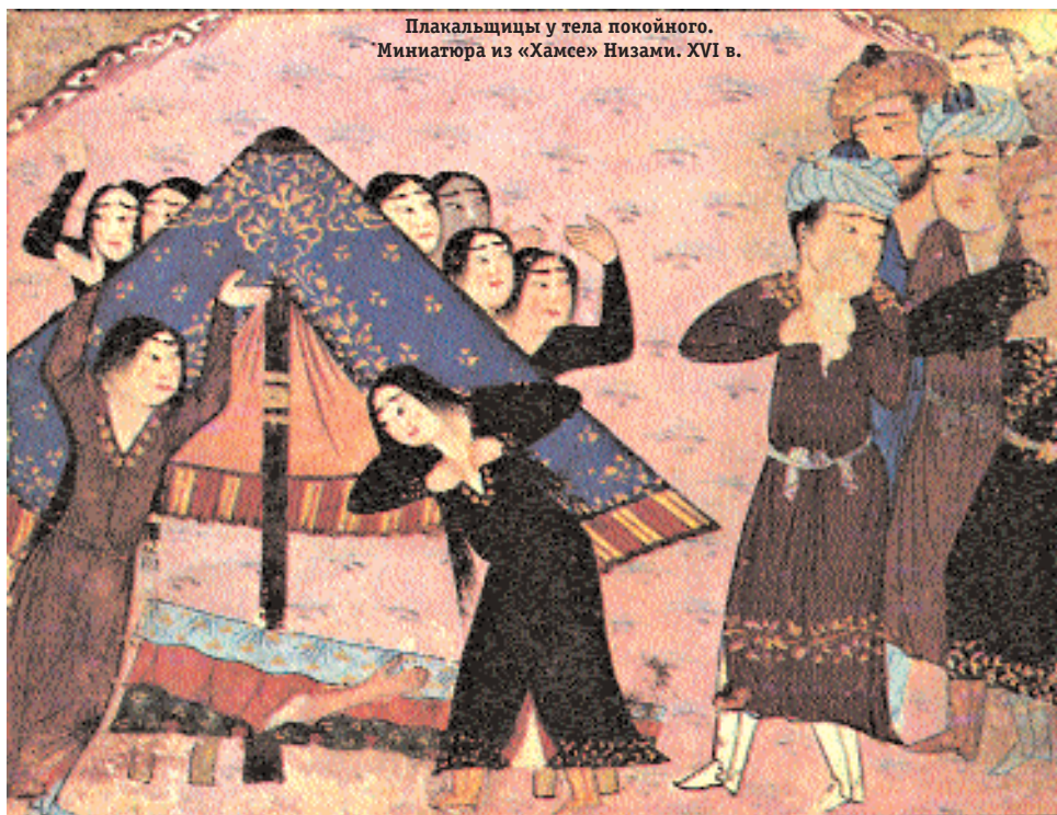
Плакальщицы у тела покойного. Миниатюра из «Хамсе» Низами. XVI в.

Сегодня Москва – едва ли не главный центр ислама в России. Мусульманская община города – вторая по численности после православной. В современной Москве проживает более 1 миллиона этнических и новообращенных мусульман, действует 4 мечети (Историческая на Большой Татарской улице, Соборная в Выползовом переулке на проспекте Мира, в Отрадном на ул. Хачатуряна, Мемориальная на Поклонной горе), не считая мечетей при посольствах исламских государств (например, шиитская при Иранском на ул. Новаторов), 20 общин и приходов, из которых 2 афганские, боснийская, турецкая, исмаилитская и другие.