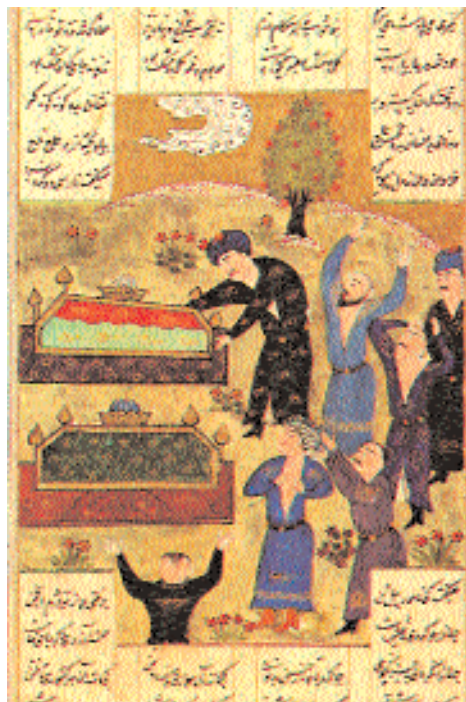
Сцена оплакивания на кладбище. Миниатюра из «Шах-наме» Фирдоуси. XVI в.

(убитому или умершему герою) на его могиле приносили в жертву верблюда. Сначала так было и у первых мусульман.