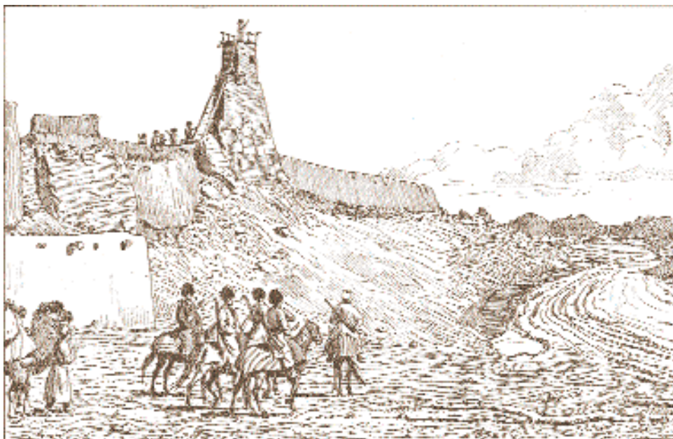
Выезд туркменов из пограничной крепости.

го перед властями. При таких условиях легче было пробраться в Дейдади, чем побывать в Мазар-и-Шарифе...».