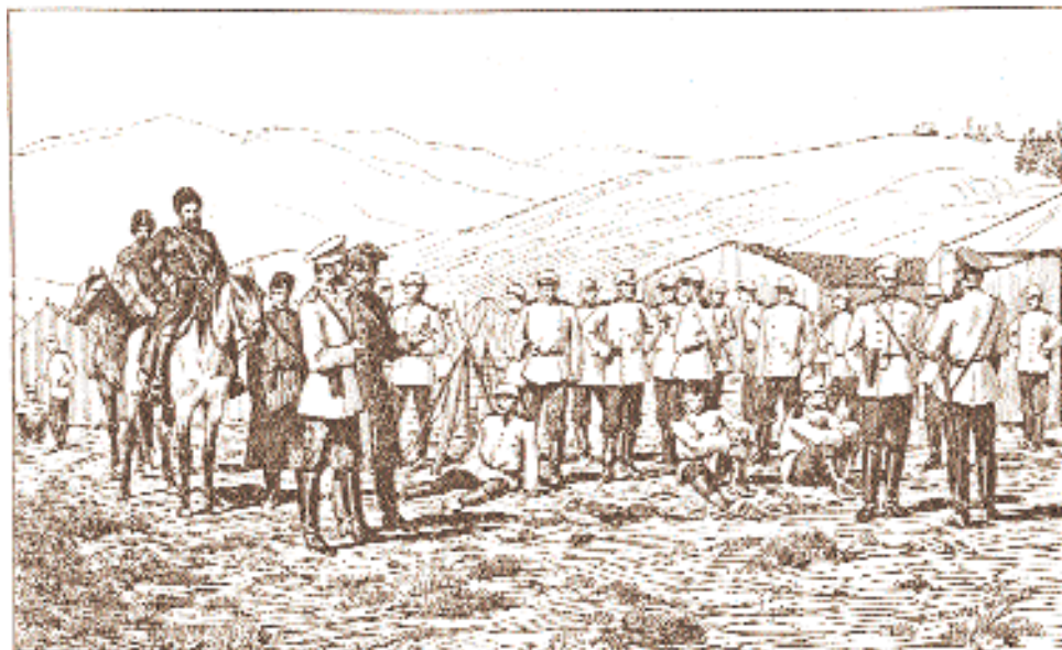
В оформлении статьи использованы иллюстрации из книги: Moser H. A travers l'Asie Centrale. Paris, 6.г. PГБ: W 310/32.