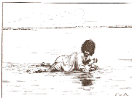
Переправа на бурдюке.

В это время в чайхане снова появился афганский офицер, заходивший ночью, и, увидев всё ту же туркменскую троицу, отчитал их: «Вы ещё не уехали на службу? Убирайтесь отсюда!». «Ослушаться прика-