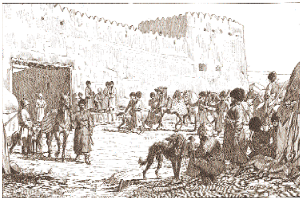
Крепость в Туркестане.

Следует добавить, что к 28 годам выпускник Академии Корнилов владел тремя европейскими языками, а также персидским, татарским и несколькими языками народов Средней Азии. Он постоянно со-