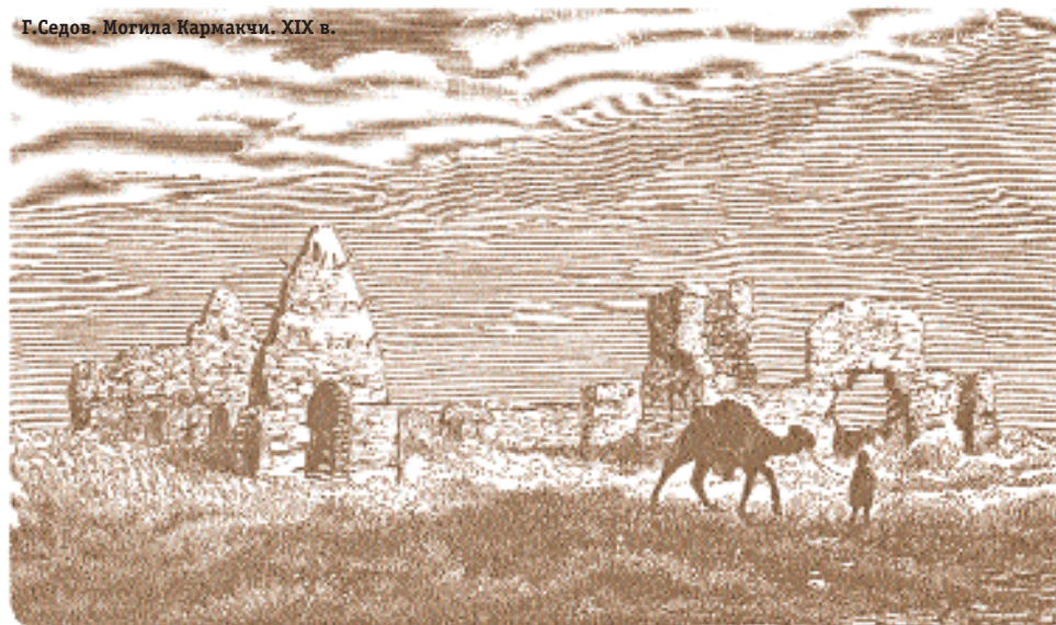
Г.Седов. Могилы Кармакчи. XIX в.

Но в обыденной жизни эти реликты продолжают жить, переплетаясь и взаимодействуя с исламом, представляя собой своеобразный религиозный синкретизм, который ярко проявляется в «бытовом» или, иначе называемом, «народном» исламе.