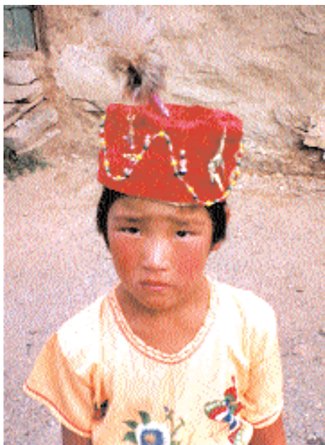
Святыня Гаухар-ана, дочери Ходжа Ахмада Ясави. Южный Казахстан. 2002. Священный ягнёнок среди паломников на одной из святынь Восточного Казахстана. 2002. Девочка в шапочке, украшенной перьями филина, являющимися оберегом от глаза. Северо-Казахстанская область. 1998.

поста ( ораза ) у дверей домов соблюдавших пост семит. Обряд колядования стал частью народного ислама. В некоторых регионах Казахстана эта традиция возрождается.