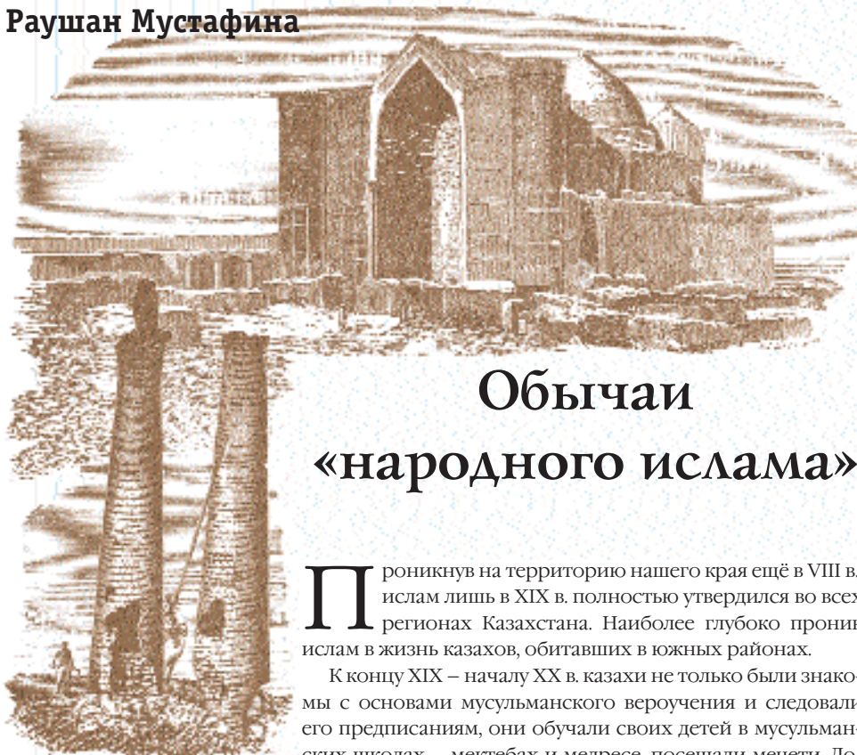
В.Крюков. Храм Азарет-Султана и Башни Саурана. XIX в.