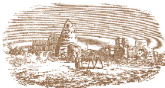
В. Васнецов. Надгробные памятники у киргизов. XIX в.

Эта семья представляется крайне примечательной. Своё генеалогическое древо она связывает с реальным историческим лицом – восточнотуркестанским суфием Хазратом Ишаном, или иначе Хидайаталлах (Аппак/Афак)-ходжой (XVII в.), правнуком знаменитого среднеазиатского суфийского деятеля Махдум-и Азама. Он был главой белогорской секты ишкыйа братства накшбанди-ходжагон в Восточном Туркестане. Народная