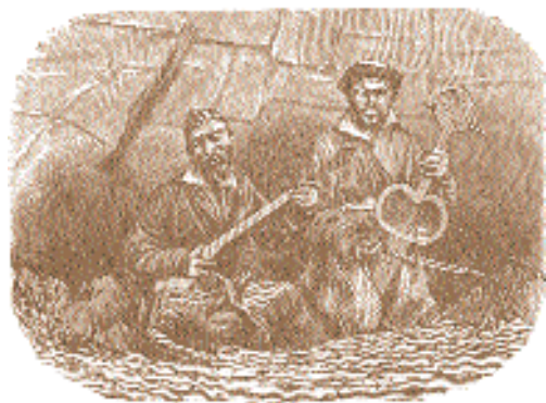
Ф. Дмоховский. Баксы. XIX в.

В наши дни проявления суфизма обнаруживаются в группах так называемого не-