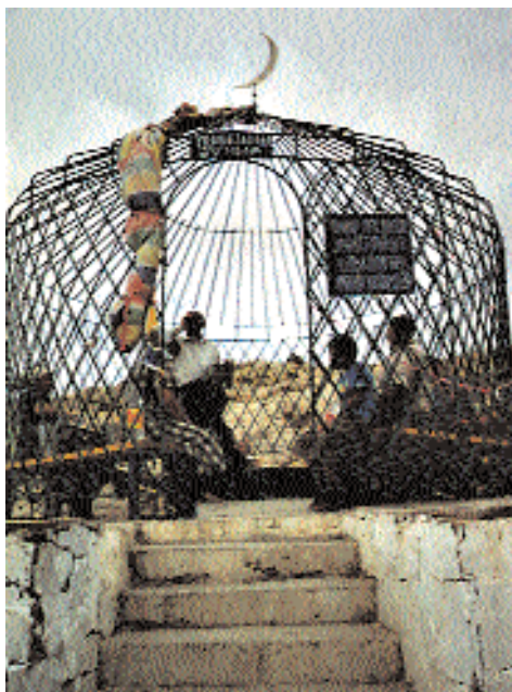
Паломники у святого колодца Укаша-ата. Южный Казахстан. 2002. Святыня Арыстан-баб. Южный Казахстан. 2002. Святыня Шахан-ата. Южный Казахстан. 2002.

элементами нового исламского мировоззрения – так называемого «народного ислама».