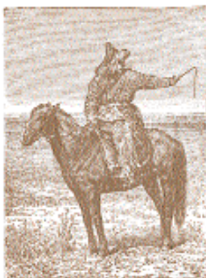
В. Васнецов. Киргиз верхом.

Рисунки Васнецова были уже отправлены в Париж, когда Верещагин, человек с очень сложным и непред-