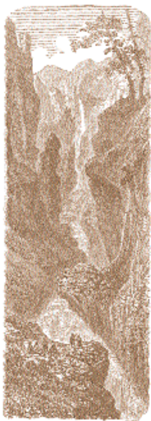
Худ. Роньят. Река Копалка.

Н. Карзин. Почтовая езда в пустыне Каракумы.