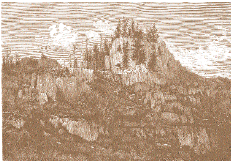
Ф. Дмоховский. Скала Коне-Даба.

Илийского выселка» можно увидеть в альбоме «Живописная Россия».