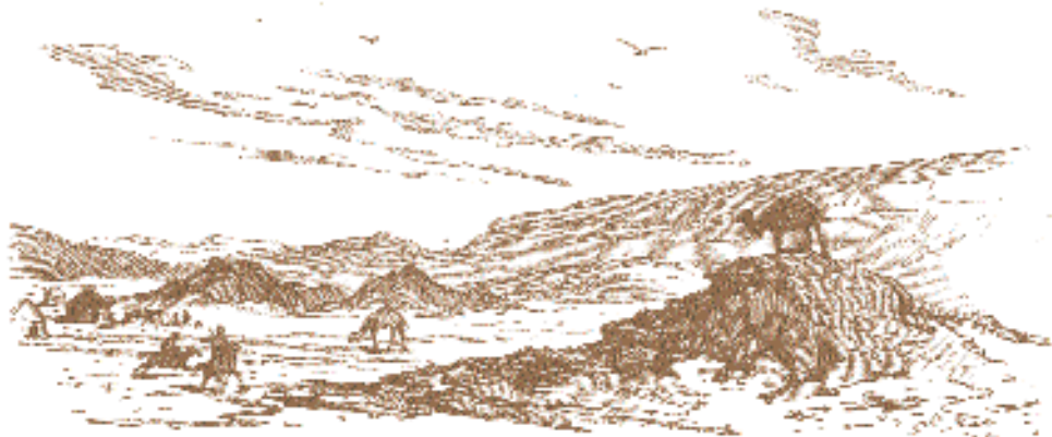
Н. Каразин. Долина Апазир.

ми. В волнах ковыля медленно бродят косматые верблюды, пестреют весёлые табуны коней, словно талый снег белеют несметные овечьи отары. Всадники с гиком и свистом носятся по степи, то исчезая в дымке знойной ночи незаметными точками, то взлетая на курган и неподвижными силуэтами останавливаясь там, словно на страже... Издалека слышны заунывные песни, блеяние овец, хриплый, свирепый, задыхающийся от злости, лай собак, бог весть откуда, наперерез несущихся на звук почтового колокольчика... Живая характерная картина! Длинными вереницами, методично позванивая бубенцами, тянутся торговые караваны; тяжёлые полосатые тюки важно колышутся по бокам верблюдов, философски на ходу пережевывающих свою колючую жвачку. Иные караваны тянутся на колёсах, точно вроде наших телег».