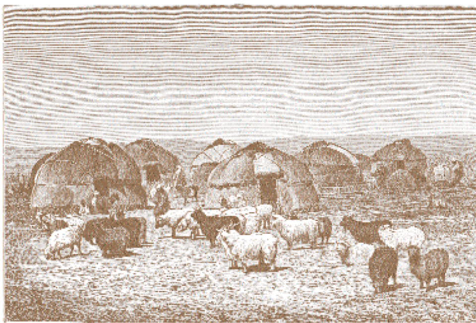
В. Васнецов. Киргизы в степи.

неба и скудной степной растительности выглядит монументально.