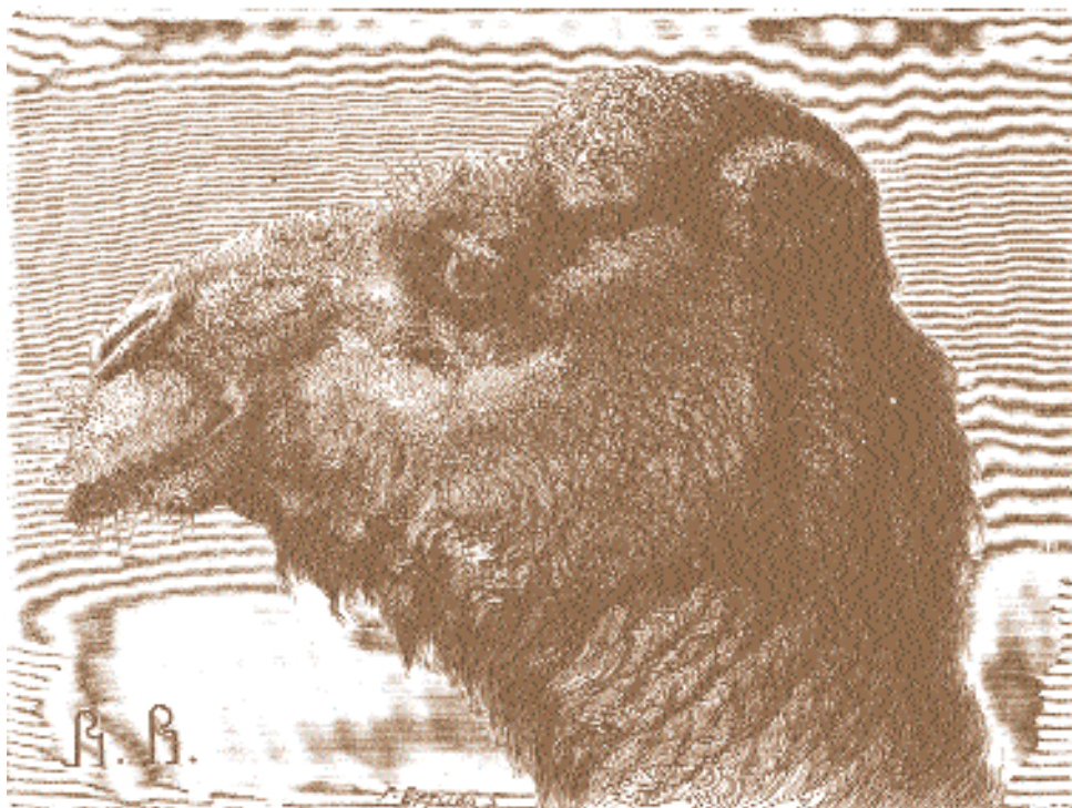
В. Верещагин. Верблюд.

чатления о Востоке воплощаются Верещагиным в работы «Опиумеды», «Обожатели бачи» – эти пласты жизни с точки зрения официального академического искусства были запретными. В 1868 г. В.В. Верещагин из Ташкента был командирован в Семиреченскую область, где создал работы «У дверей мечети (мечеть Ясави в Туркестане)», «В горах Ала-Тау».