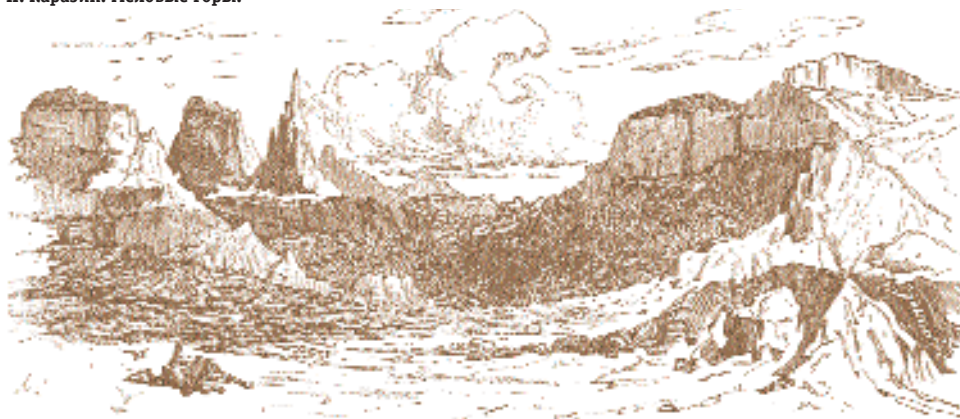
Н. Каразин. Меловые горы.

В конце XIX столетия в музее Западно-Сибирского отдела Русского Географического общества хранился альбом рисунков Н.Н. Каразина с казахскими пейзажами. Судьба этого альбома пока неизвестна. Большинство рисунков Каразина из его путешествия по Казахстану помещено в качестве иллюстраций в альбомах «Живопис-