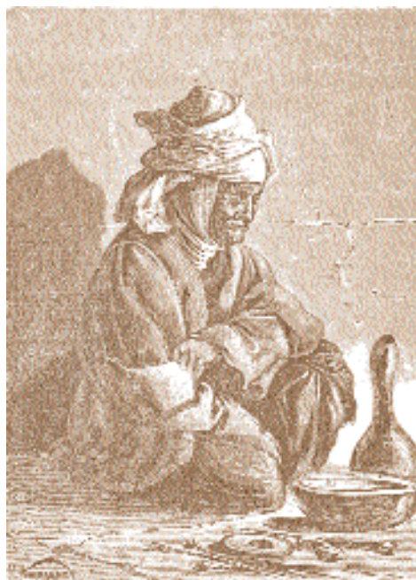
Н. Каразин. Пожилая киргизка.

ная Россия», «От Оренбурга до Ташкента», «С севера на юг».