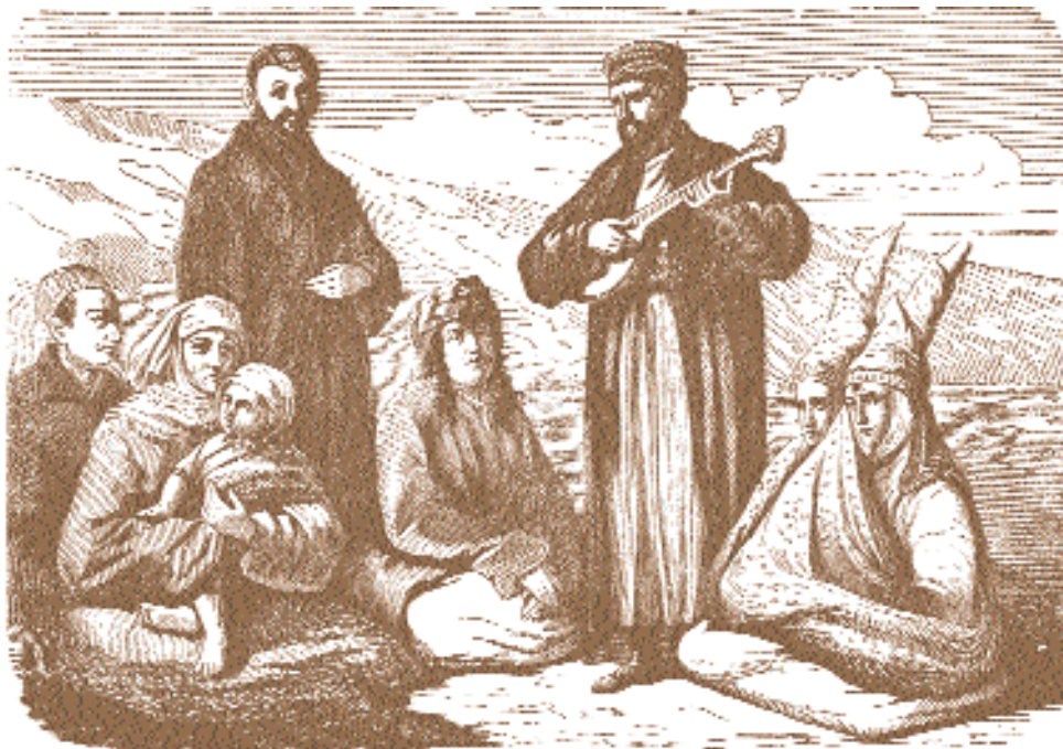
В. Верещагин. Группа киргизов; справа две невесты.

Затем были Орск и Карабутаг, впечатления от надгробных сооружений в казахских степях. В низовьях Сырдарьи внимание художника привлекли следы исторического прошлого. Возле древних гробниц Джанкента художник поселился на несколько дней в юрте, получив возможность наблюдать жизнь и быт народа. В городище Джанкент он собирает образцы керамики, изразцов, зарисовывает их в походные альбомы. Реальные впе-