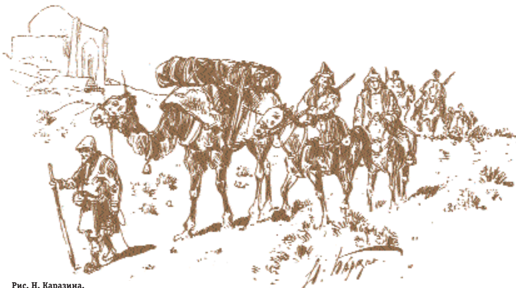
Рис. Н. Каразина.

Не остались без оценки А.И. Бутакова традиции и нравы казахского общества. В частности, он отмечает поверхностную исламизацию казахов. Поэтому «прокламации Хивинского хана, которыми он старался возбудить против нас религиозный фанатизм киргизов, остались бесплодными. Вся религиозность киргизов заключается в том, что они не едят свинину, а о Коране слышали весьма немногие из них». Упоминается существовавший у казахов обычай о выплате куна (материального возмещения) за убийство родственникам убитого. «Около 20 декабря пришёл в Раим из Бухары небольшой караван из 19 верблюдов, с бухарскими коврами и халатами и бумажной материей (матой), один верблюд был нагружен рисом, урюком и кишмишем, но эти последние при-