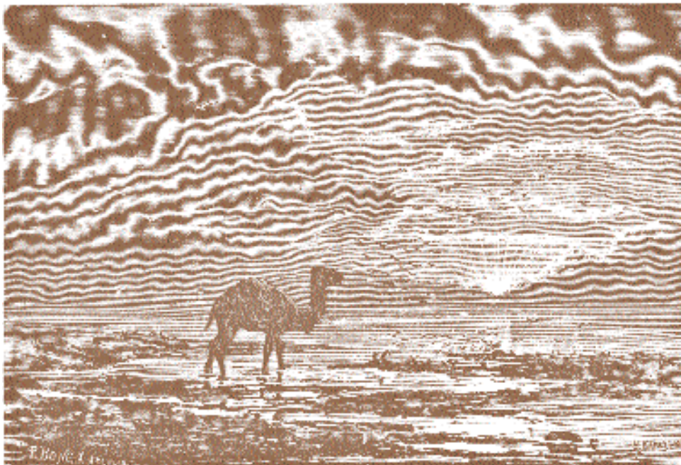
Н. Карзин. Вид Аральского моря: северо-восточный берег.

В оформлении статьи использованы иллюстрации из издания: Живописная Россия. Отечество наше в его земельном, историческом, племенном, экономическом и бытовом значении. СПб.–М. Т. X (1885), XI (1886). РГБ: И 268/67; ф 10-81/385; и из книги: Дневные записки плавания А.И. Бутакова по Аральскому морю в 1848–1849 гг. Ташкент, 1953. РГБ: С 289/691.