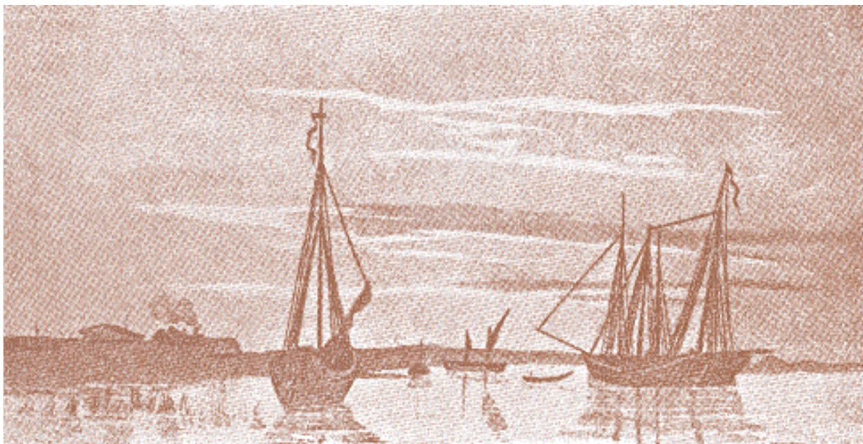
Остров Кос-Арал. Рисунок Тараса Шевченко.

морского штаба ВМФ Российской империи А.С. Меншикову 1 .