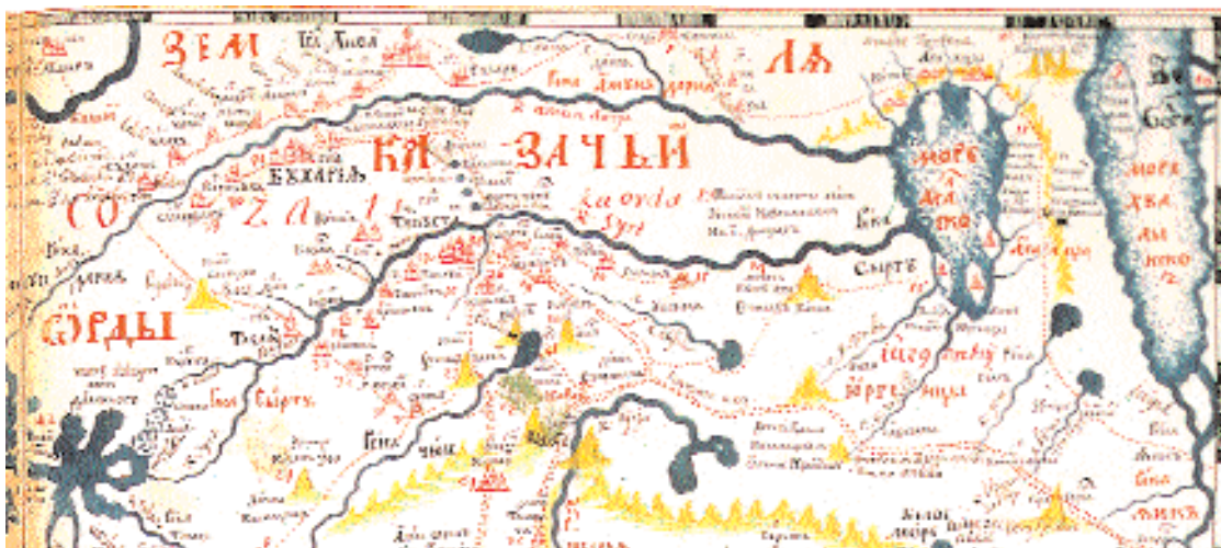
Фрагмент карты с изображением Аральского моря и прилегающей территории из «Чертёжной книги Сибири» С.У. Ремезова. По традиции XVII в. север на карте внизу.

ший «Николая», и доставлен к Раиму уже описанным выше способом. Командиром «Константина» стал Алексей Иванович Бутаков, который изучил берега Арала, кроме восточного, открыл и описал группу островов. Жившие на берегах Аральского моря казахи (тогда их называли киргизами), каракалпаки, узбеки, туркмены не имели парусных судов и плавали поблизости от берега, не углубляясь в открытое море. Так что возможно, до появления российских экспедиций, на острова не ступала нога человека.