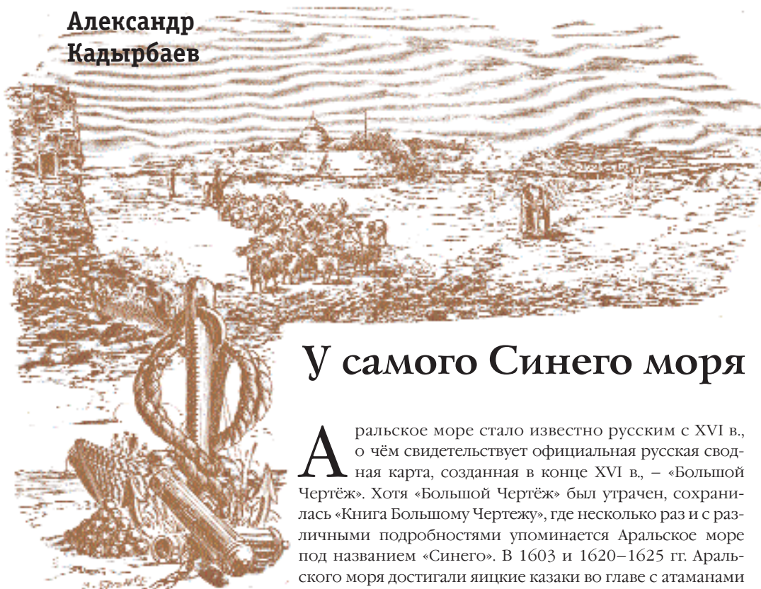
Рис. В. Крюкова.