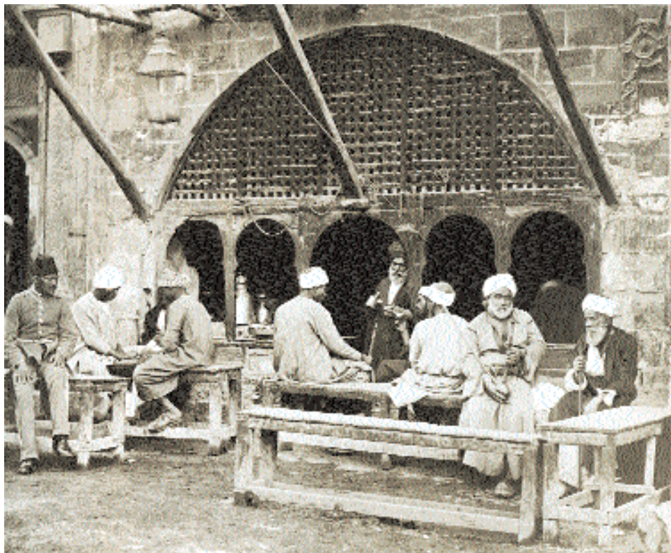
Арабская кофейня. Фотография XIX в.

Кофе становится любимым напитком селян и горожан, а трубки и кальяны – неременной принадлежностью любой, даже самой маленькой и бедной кофейни. Кофейни же появляются повсюду, в городах и деревнях. В Малой Азии каведжи (продавцы кофе) иногда просто складывали очаг из камней у дороги, располагались в тени под деревом со своими припасами и предлагали бодрящий напиток проезжающим. «Везде, где есть несколько анатолийцев, есть уже и кофейня, хотя бы то было под открытым небом», – пишет русский путешественник. Однако настоящая кофейня – это, конечно, не импровизированный очаг у дороги, где можно на ходу проглотить чашку кофе, а место, куда люди приходят отдохнуть, пообщаться, подумать, в общем, содержательно провести несколько часов. «Табак, – писал в начале XIX в. Р. Вальш, сопровождавший британского посланника в путешествии из Стамбула в Англию, – считается необходимой вещью у турок: употребление одного неразлучно с кофе,