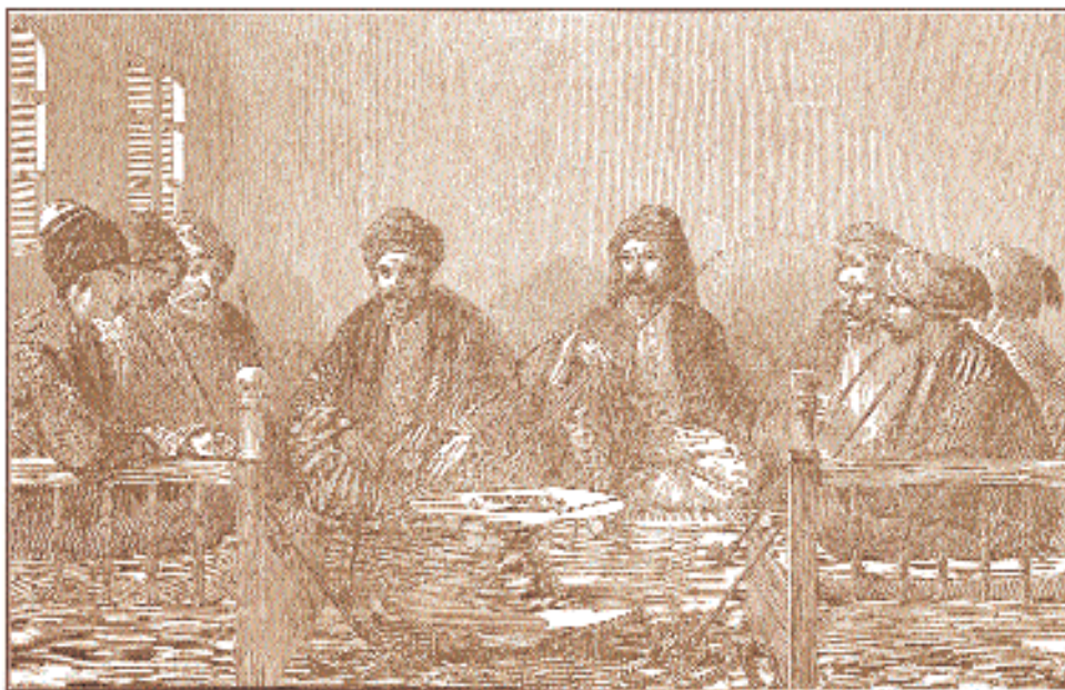
Вечер за трубкой или наргиле в кофейне проводили турецкие мужчины любого достатка.

альный султанский указ, запрещающий делать и продавать трубки, инкрустированные золотом и драгоценными камнями. Особым искусством долгое время оставалось создание длинного мундштука из черешневого дерева или из особо ценимого жасмина. В пригороде Стамбула Ортакёе жасмин для этой цели выращивался специальным образом: чтобы получить абсолютно прямой ствол, по мере роста на него надевали металлические кольца. Готовый материал высушивали полтора года и затем с помощью длинного сверла изготавливали мундштук.