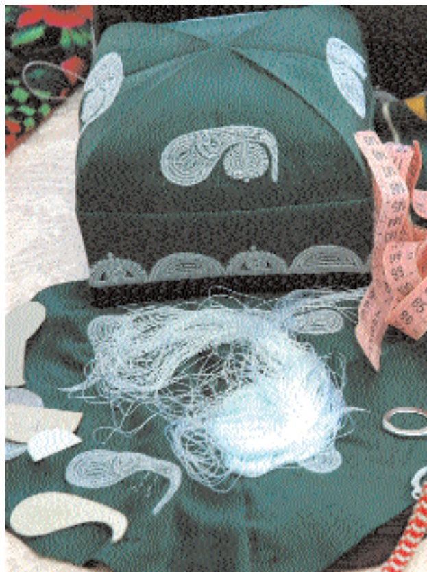
Ферганские тюбетейки; справа – для новорожденного.

Оригинальной разновидностью является бухарская золотошвейная шапочка.