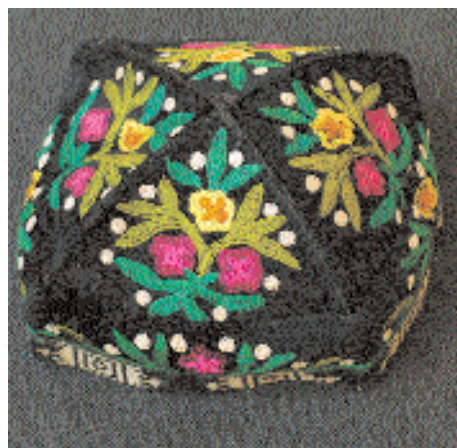
Заготовки женской тюбетейки. Бухарская и ташкентская женские тюбетейки.

В композиции большинства изделий преобладают изображения кустов с распусившимися цветами, кругов, розеток, цветов на тонких стеблях, побегов с листьями. В раститель-