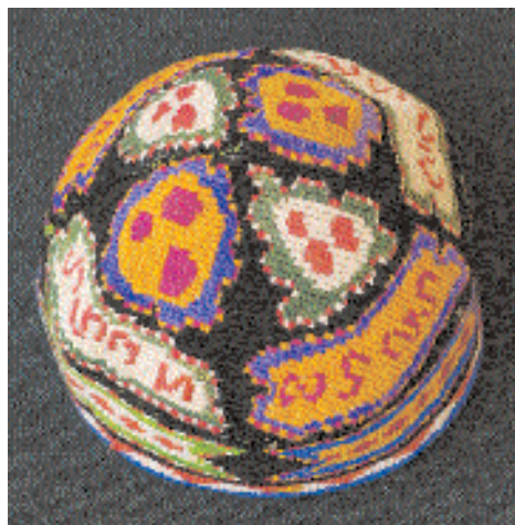
Тюбетейка из Шахрисбада.

Она бывает обычно круглой или четырёхгранной, с растительным или геометрическим орнаментом, с бахромой и нарядными кисточками, а золотое шитьё придаёт тюбетейке яркую красочность и торжественность. Недаром же золотошвейные тюбетейки были неперменной деталью костюма эмира и придворной знати, а в наше время являются обязательным элементом свадебного наряда. Любопытно, что