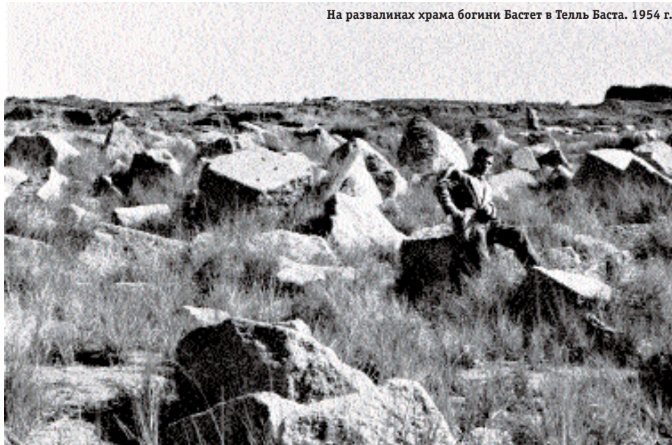
На развалинах храма богини Бастет в Телль Баста. 1954 г.