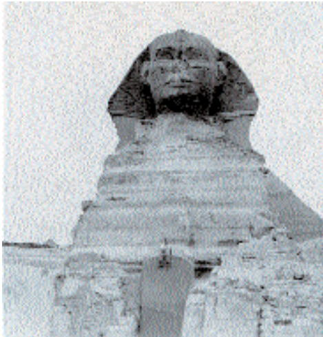
У Великого сфинкса в Гизе. 1954 г.

Александрия. Колонна Диоклетиана и сфинкс – всё, что осталось от Серапеума.