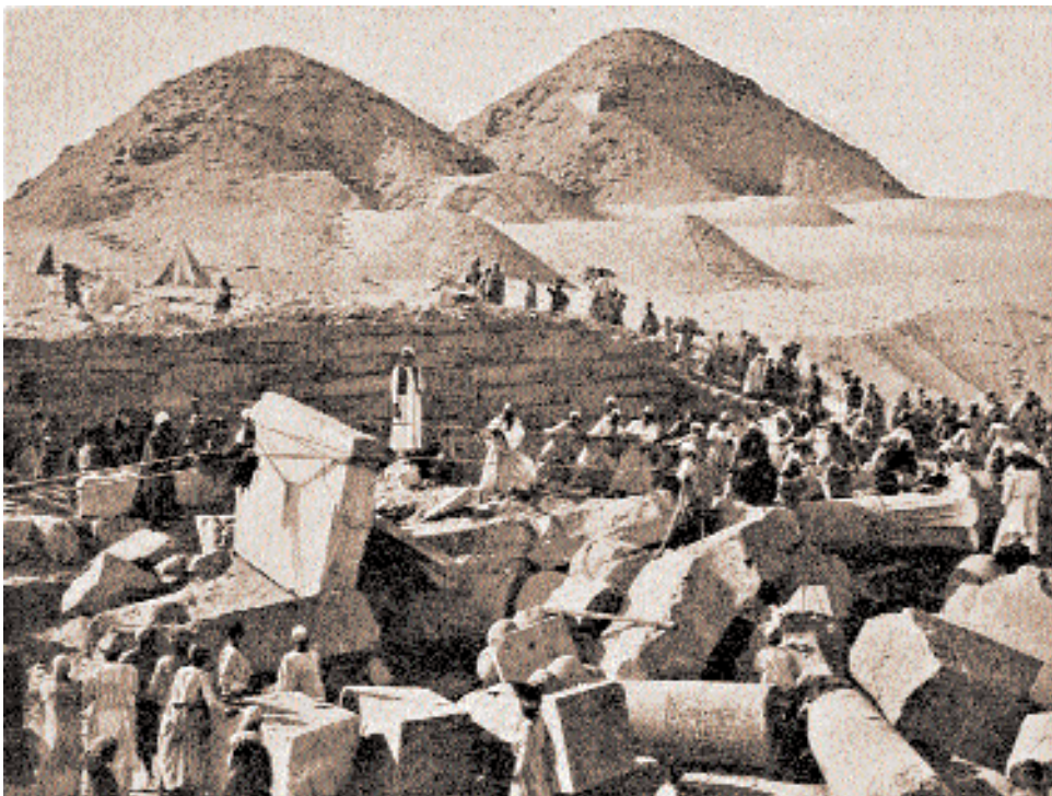
Абу Сир. Работы группы Л. Борхардта в северо-восточной части комплекса Сахура.