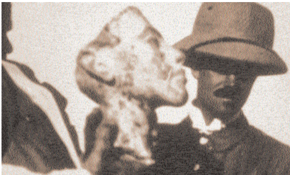
Одна из первых находок в мастерской Тутмоса в Эль-Амарне – портрет Эхнатона.

плотины, которое планировалось осуществить в 1898–1902 г. Исследователи пытались до начала строительства спасти наиболее ценные экспонаты. В обязанности Борхардта входило не только изучение фундамента храмового комплекса, но и исследование надписей в храме, которые были необходимы А. Эрману для создания словаря древнеегипетского языка. Так Людвигу поневоле пришлось заняться эпиграфикой.