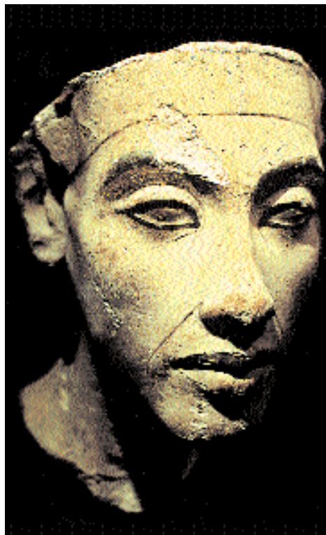
Эхнатон. Скульптурный портрет из мастерской Тутмоса в Эль-Амарне. Известняк. Берлин, Египетский музей.

сводки о раскопках и находится в курсе всех археологических работ в стране. Его «Очерки о немецких и других иностранных раскопках в Египте» по праву являются анналами ранней египтологии, в которых он описывает целое десятилетие археологической деятельности на памятниках по всему Египту. Знания и опыт учё-