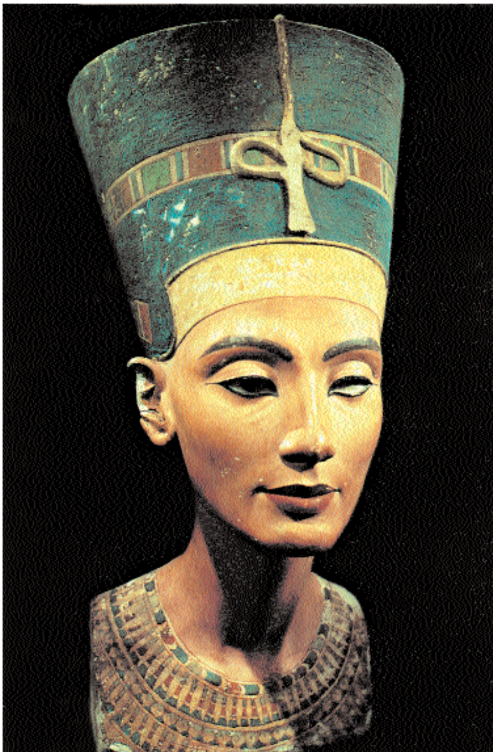
Нефертити. Скульптурный портрет из мастерской Тутмоса в Эль-Амарне. Известняк. Берлин, Египетский музей.

Правительство в те годы финансово не поддерживало раскопки и исследователи зачастую вели их на свои средства или же привлекали спонсоров.