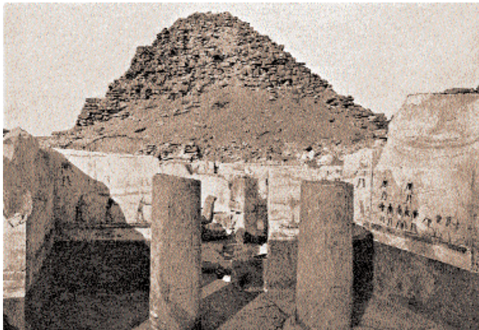
Абу Сир. Святилище припирамидного комплекса царя Сахура. XXV в. до н.э.

Однако немцы потеряли концессию на раскопки, которая перешла к англичанам. С 1924 по 1928 г. Борхардту остаётся вести небольшие исследования и раскопки в целях консервации находок. Ещё через год, в возрасте 65 лет археолог уходит с поста директора Института. Что было причиной такого решения, нам, к сожалению, неизвестно. В 1929 г. Институт был переименован и превратился в отделение Германского