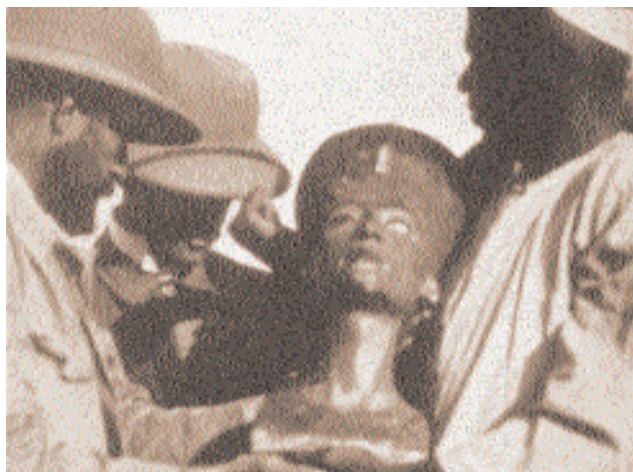
Хроника находки скульптурного портрета Нефертити.

ность глазницы выполнена тщательно и не была предназначена для инкрустации». Полноценное обследование памятника, проведённое в Берлине, в целом подтвердило гипотезу Борхардта о том, что бюст царицы был скульптурным портретом, а не культовым образом. Был также сделан вывод, что бюст Нефертити не был незавершённым, как предполагалось. Скорее всего, отсутствие одного глаза объяснялось магической причиной.