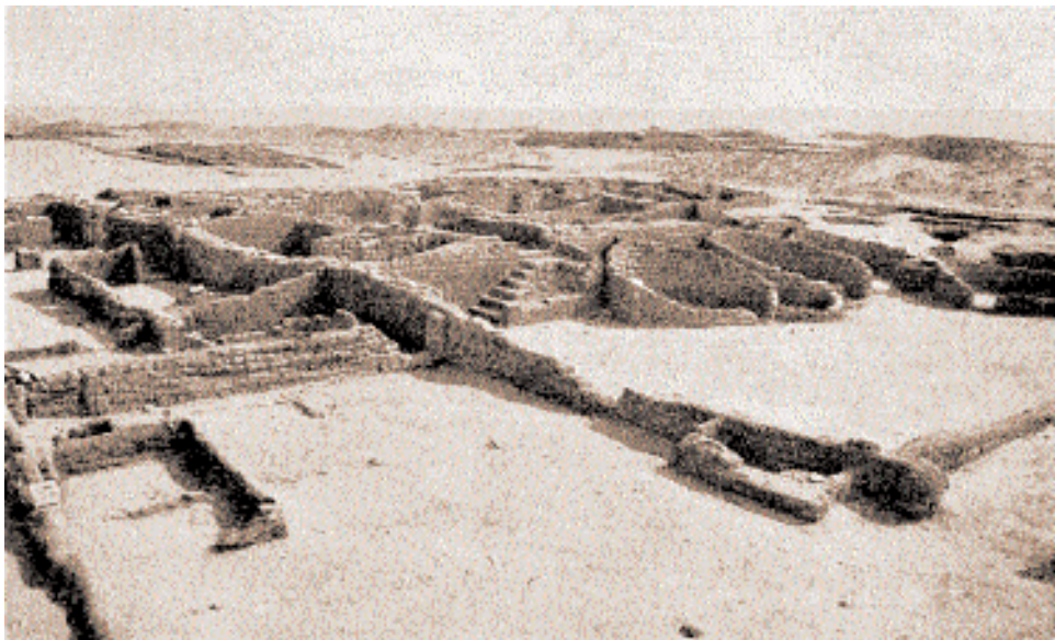
Мастерская скульптора Тутмоса в Эль-Амарне, где был найден знаменитый портрет Нефертити.

ного способствуют формированию профессионального отношения к коллекционированию древностей. Выступая в качестве эксперта, Борхардт помогает немецким музеям и частным коллекционерам пополнить свои собрания египетскими древностями, содействует созданию Deutschen Papyrus-Kartell – государственного