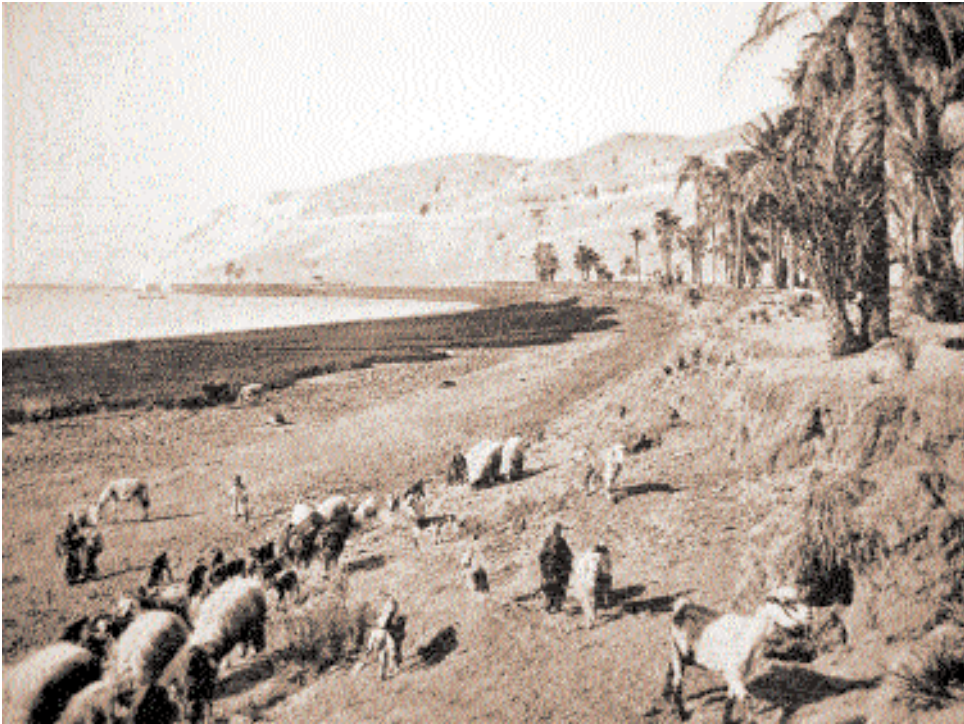
Берег Нила близ деревни Хагг эль-Кандиль у западной окраины Эль-Амарны.

Если бы оба глаза были инкрустированы, то бюст, изготовленный на основе гипсовой маски, снятой непосредственно с лица Нефертити, имел бы огромное сходство с живой царицей. Тогда случайная гибель бюста могла бы навредить «оригиналу», т.е. самой Нефертити.