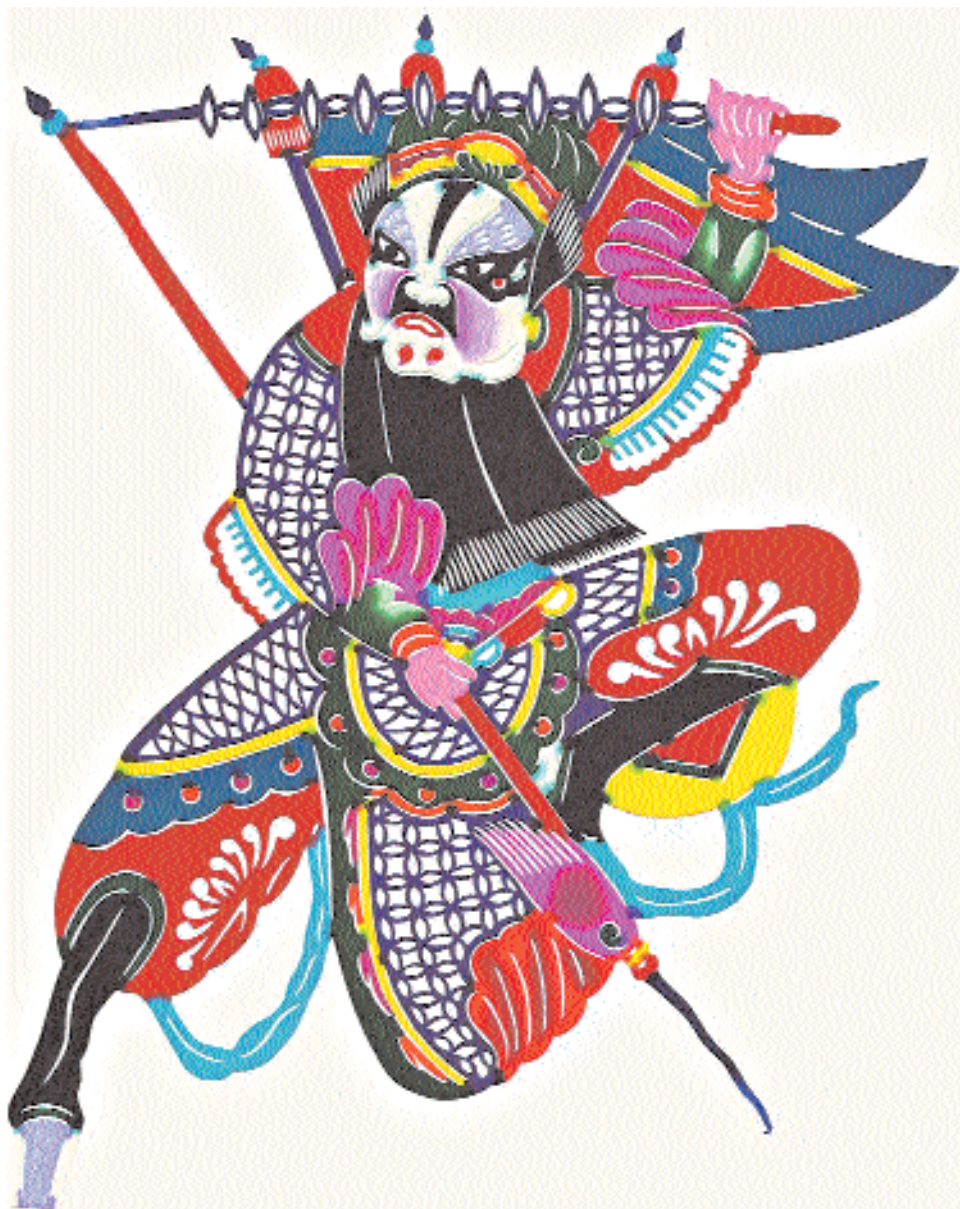
«Чжан Фэй в драме „Лухуадань – в зарослях тростника“».

метода, чтобы оставить большее пространство для расцветивания.