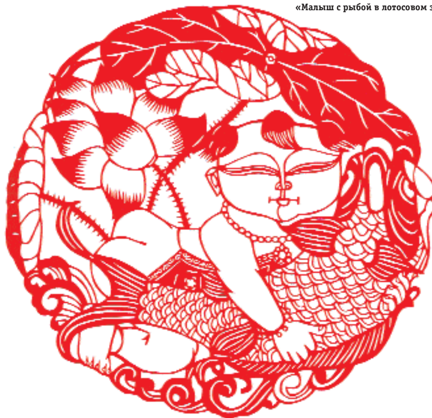
«Малыш с рыбой в лотосовом заливе».

не может быть застывшим, не развивающимся, даже когда мастер традиционно вырезает только орнаменты. Если, например, древние мастера вырезали преимущественно цветы, животных (что связано