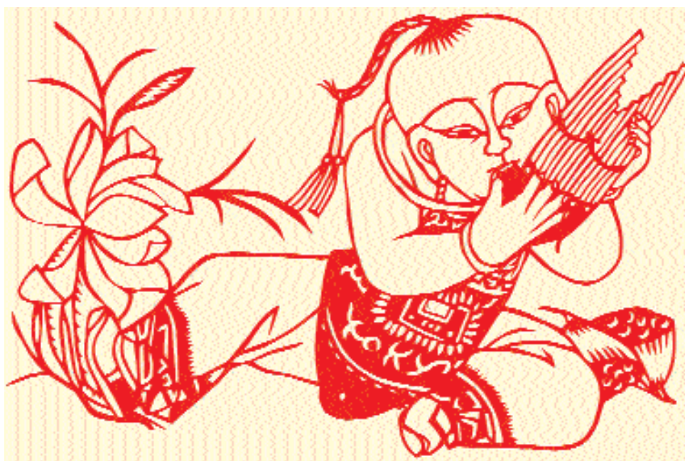
«Малыш играет на губном органчике шэн ».

В заключение для тех, кого заинтересовало это трогательное и удивительно привлекательное искусство, могу сообщить, что для знакомства с ним вовсе не обязательно ехать в Китай. С 2000 года в Историко-художественном музее г. Домодедово Московской области открыта постоянная экспозиция китайских вырезок из коллекции учёного-литейщика Алексея Максимовича Петриченко (1911–1996), насчитывающая около 2, 5 тыс. единиц хранения.