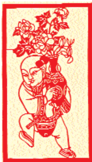
«Мальчик с вазой».

Большое место детской теме отводится в вырезках нового стиля, в которых уже почти не отводится места ни символике, ни благопожеланиям. Их сюжеты тесно связаны с повседневной жизнью – учёбой, трудом, развлечениями, спортом. Такие вырезки представляют собой большей частью невзыскательные миниатюры, выполненные крупными мазками, широкими плавными линиями с резкими (рублеными) переходами и острыми окончаниями, без подробностей и тонких деталей рисунка. Они отличаются определённым техническим упрощением, в них видны нарочитая простота и лаконизм. Но именно такой стиль наивного обобщения вполне соответствует их главному назна-