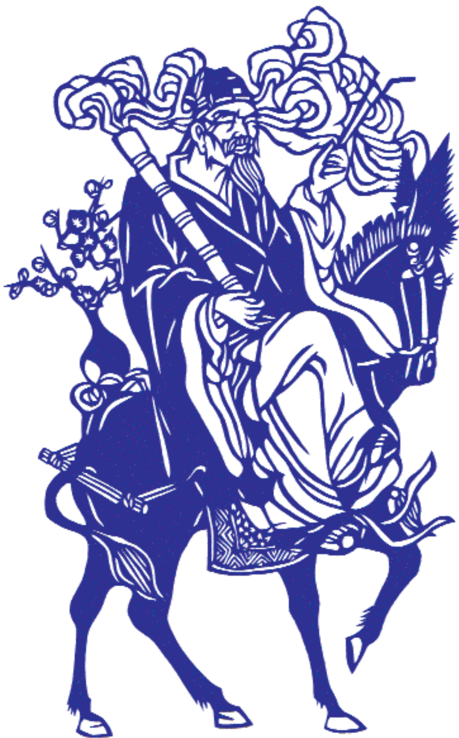
«Чжан Голао – один из легендарных восьми бессмертных басянь ».

ми бессмертных басянь », провинция Чжэцзян). Композиции в них отличаются компактностью, живописностью и мягкостью, включением плотных «пятен» с орнаментом и узорными прорезями. Такие вырезки всегда декоративны как по сюжету, красочности, так и по формированию линий; вместе с тем искусное, продуманное перепле-