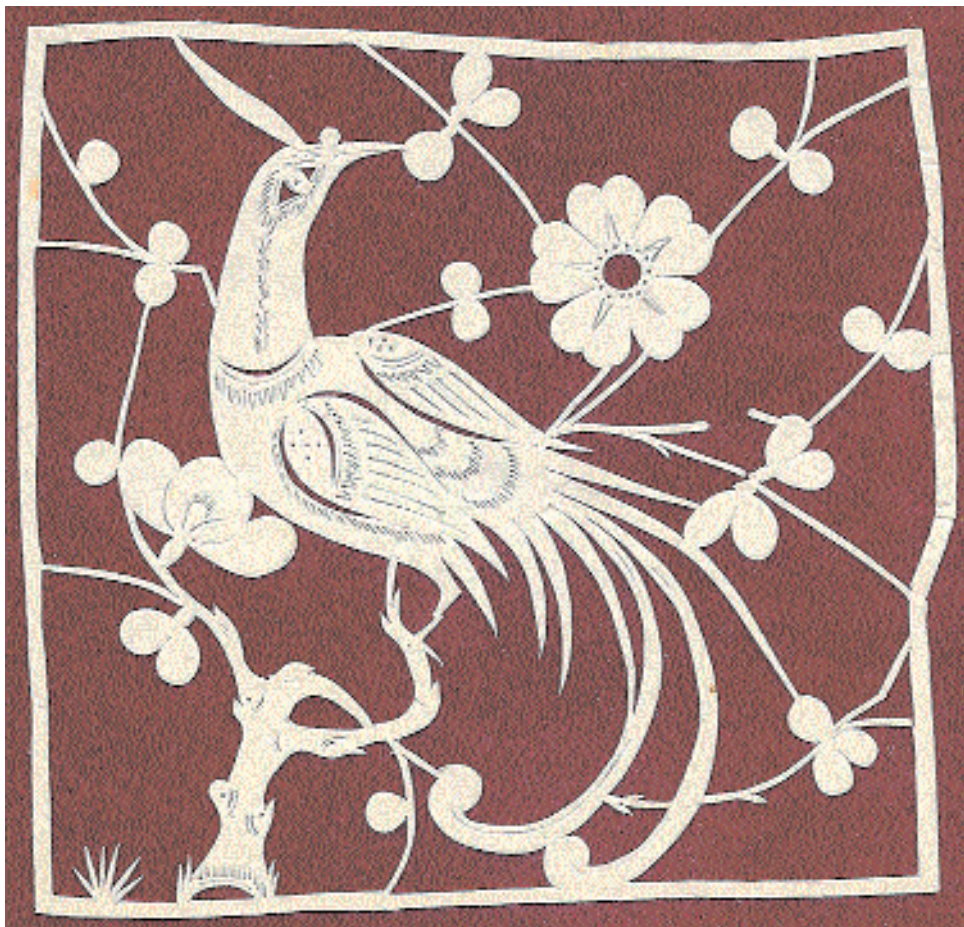
«Птица луань в саду».

точных видов, когда при доминировании основного стиля используются элементы других. Так, вырезка-образец для вышивки («Птица луань в саду», г. Тяньцзинь), выполненная в чеканно-силуэтном стиле, приобрела особую декоративность благодаря сочетанию острой выразительности рисунка с ажурными элементами, выполненными мелкими односледными прорезями. Кроме того, каждый большой мастер создаёт свой собственный, неповторимый стиль. Однако при всём многообразии стилей больше всего поражает то, что всем вырезкам присуще единство художественной образности и национального колорита. Это можно сравнить с единством китайского письма. Сотней способов можно