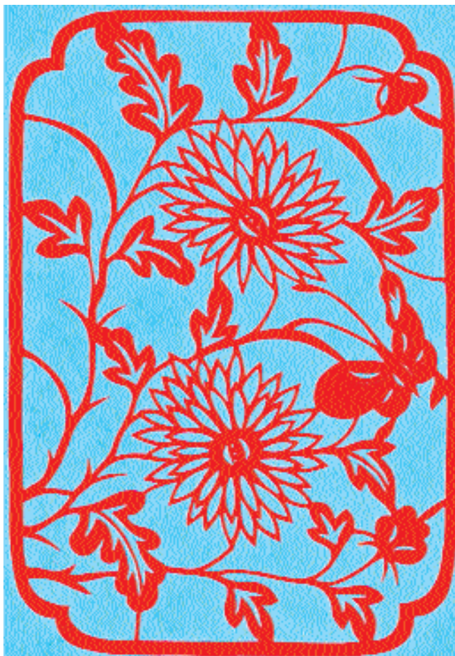
«Цветы и бабочка».

По способу создания рисунка вырезки чётко разделяются на две группы: обычные и просветные (или трафаретные), по китайской терминологии янские и иньские . В первых контуры рисунка создаются самой бумажной поверхностью, а прорезы служат лишь для образования фона и моделирования объёма, для выписывания характерных деталей и оттенения переходов на бумажных плоскостях изображения. Иначе говоря, бумажные полоски и плоскости выполняют