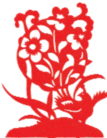
«Мифологическая птица луань с хвостом в виде цветов».

смешанная техника резьбы, когда в «позитивную» вырезку вставляют «негативные» участки для придания лёгкости, для разрежения плотных силуэтов («Мифическая птица луань с хвостом в виде цветов») или чтобы подчеркнуть оборотную сторону листка, лепестка и т.д. («Вот так кукуруза!», провинция Шаньдун). В результате такой тип вырезок выглядит более сложным, искусным, сохраняя каллиграфически чёткий стиль, поэтому получает всё большее распространение.