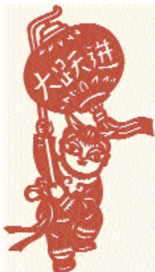
«С круглым фонариком».

с китайской символикой), театральные и религиозные сценки, то современные художники чаще обращаются к пейзажам и архитектуре, к современным литературным героям, к событиям новейшей истории, но, прежде всего, к жанровым зарисовкам современной жизни города и деревни, отображая труд, быт и развлечения людей. Изменение тематики происходит и под влиянием утраты народным искусством утилитарных функций и расширения декоративной, эстетической и пропагандистской функции.