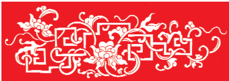
«Орнамент с лотосами».

Китайские художественные вырезки чрезвычайно разнообразны как по манере зарисовок, так и по творческому почерку выполнения резьбы. Но все они обладают свойственным только этому виду искусства единым изобразительным стилем. Поскольку вырезки не допускают разрыва в своём прозрачно-кружевном рисунке, изображениям всегда присуща некоторая условность – мастер всё подчиняет красоте силуэта, и отклонения от реальности делаются вполне сознательно. Назначение вырезок вполне конкретное, поэтому они должны обладать ясным и чётким, легко прочитываемым содержанием. И это отличает вырезки от многозначительной традиционной живописи с её полутонами и полунамёками, от декоративно-прикладного искусства с его «чистым» орнаментом или замысловатыми орнаментальными изображениями «птиц и цветов», даже от народного лубка, где содержание можно раскрыть не только с помощью многофигурности и большого количества предме-