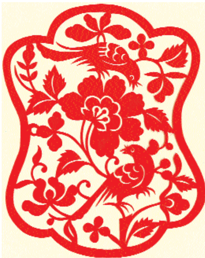
«Птицы и цветы».

и в сувенирных отделах крупных магазинов, отелей и аэропортов. Правда, их практическое применение изменилось. Только в деревнях и очень редко в городах их используют как праздничные украшения жилищ, зато увеличилось их декоративное значение. Ими сопровождают письма и поздравления, широко применяют в полиграфии, оформляют в виде картин в рамках или в виде свитков. Всё больше внимания к вырезанию проявляют мастера традиционной живописи, не только привнося новые темы, но и изменяя приёмы изображения (например, введением перспективы). Вырезка начинает походить то на живописное полотно, то на графику, то на роспись, то на новогоднюю картинку, то на резьбу по камню или дереву.