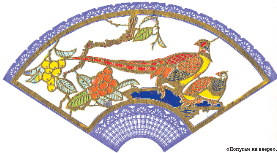
«Попугаи на ветке».

написать один и тот же иероглиф, иногда его даже трудно прочесть, но в любом случае он остаётся китайским иероглифом, который не спутаешь ни с каким другим.