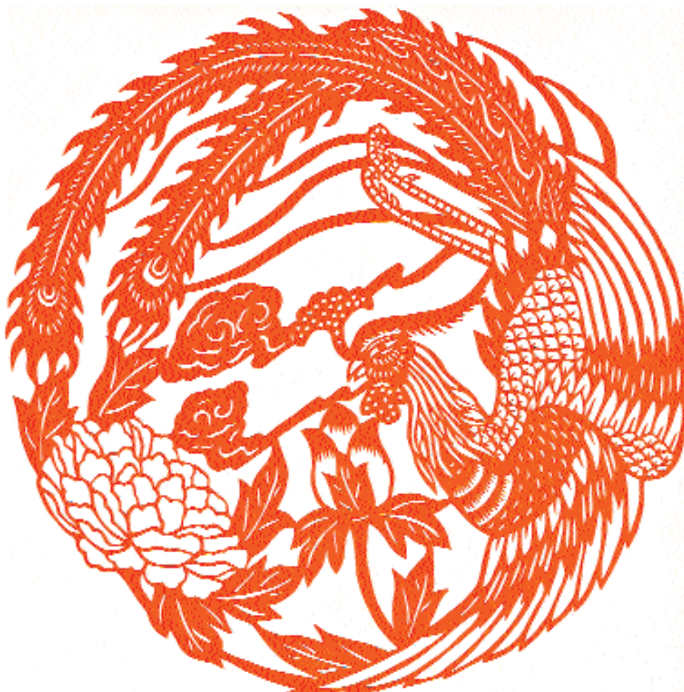
«Мифологическая птица фэн с пионом».

ту же роль, что и штрихи кисти и карандаша на обычных рисунках («Мифологическая птица фэн с пионом» – символ счастья, богатства и знатности, провинция Цзянсу). Таких вырезок – подавляющее большинство.