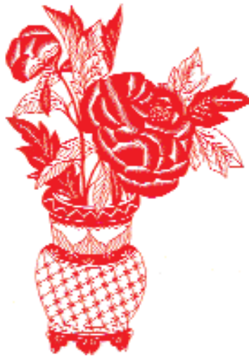
«Пионы в вазе».

Перечисленными стилями не ограничивается разнообразие художественных решений, существует ещё много промежу-